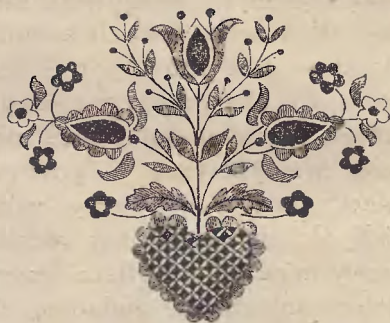
Ryc. 17. Kaszubski ornament narożnika serwety.

północy na pożytek i błogosławieństwo mieszkańców“. M. Heller w „Gartenlaube“ życzy tym haftom „rozwoju, któryby wniósł radość i zarobek do chat kaszubskich“. „Tägliche Rundschau“ opisuje obszernie rozmowę cesarzowej z państwem Gulgowskiemi, a „Königsberger Volksfreund“ głosi: „Da waren die Stickereien in solcher Vollendung, dass sie jeder Kunststätte von Berlin Ehre machen würden“. W tym samym roku uzyskują hafty kaszubskie dyplom na medal złoty na wystawie w Kaliszu. W r. 1913 na „Wanderausstellung der deutschen Landwirtschaftsgesellschaft“ w Strassburgu otrzymują pierwszą i drugą nagrodę. Wojna spowodowała zastój w tej wytwórczości, dopiero w r. 1923 rozpoczął się nawrót do dawnej pracy, o czym zaświadczyły wystawy w Sopotach, Pucku, Gdańsku, Gdyni, Krakowie, Warszawie i Paryżu.