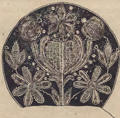
Ryc. 4. Czepek kaszubski.

W hafciarskiej technice złotogłównia dominuje ścieg wypukły (en relief), potem kładziony złoty (couchure) obok kładzionego jedwabnego (point couché), bajorkowy (canetille), niekiedy także przekłuwany i supełkowy, zarzucający najczęściej dna kwiatowe. Ciekawym środkiem zdobniczym jest linjowanie całego głównego kwiatu na denku pasemkami kładzionych nici, z których co dwie przyczepiane bywają do tła poprzecznym ściegiem nitki lnianej (ryc. 2). Powstaje z tych ściegów jakby układ rzadko rozstawianych cegiełek. Ściegi powyższe wzbogaca jeszcze obciążanie grubych łodyg trzonowych i środkowych płatków tulipanów metalowymi pasemkami, przewłóczonymi nakrzyż. Jest to więc pewnego rodzaju alheruntowanie. Ścieg płaski, atłaskowy, płomienisty (point de flamme) i koszykowy (point natté) występuje na bawełnianych i jedwabnych albach kościelnych na Pomorzu, wykonanych prawdopodobnie przez