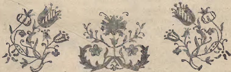
Ryc. 8. Haft biały na albie klasztornej z Żukowa.

paramencie (ryc. 13). Hafty te wykonane były niezawodnie w klasztorze — a jednak należą do tego samego typu, co i tulipany na tłach kaszubskich obrazów na szkłe (np. obrazek św. Antoniego w Muzeum wiejskim we Wdzydzach). Nie jest to przykład odosobniony, gdyż podobnie bliskie pokrewieństwo ornamentu zachodzi między typem zdobniczym złotogłowa, a kwiatowemi ozdobami, ciętymi na bokach dębowych ławek kolatorskich w Obozinie koło Skarszew 2) . Już te dwa przykłady świadczą o tem, że hafciarki czepków nie wszystko brały od swych zakonnych siostr z Zachodu, ale dopuszczały do głosu własne upodobania i własną intuicję artystyczną. Zresztą gdybyśmy ornamentację denka czepka odarli z drugorzędnych ozdób (np. bajorków), wtedy uproszczonym motywom nie odmówimy tego wyrazu, który cechuje ludowe pomysły zdobnicze (ryc. 3, 5).