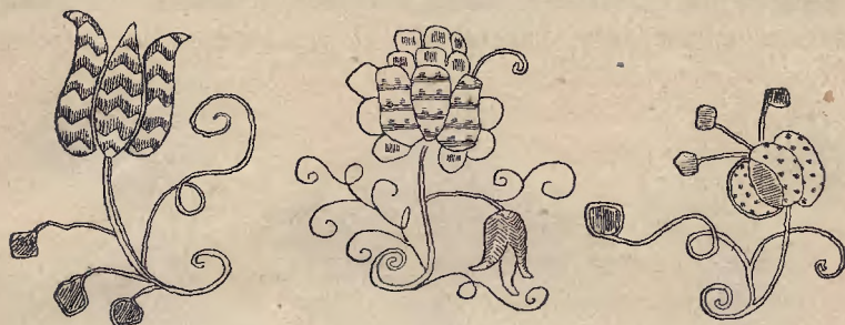
Ryc. 7. Haft nicią złotą na albie klasztornej z Żukowa.

nuszek, (ryc. 12) wyszyty barwnym jedwabiem, gęsto przetykany złotą nicią 1) , oraz kwiat wyrastający z serduszka na tymże