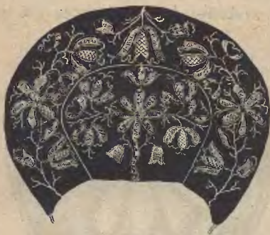
Ryc. 3. Czepek kaszubski z Wdzydz.

bardzo często oblamowywano wyszyte formy zdobnicze brunatną nitką lnianą. Cieńsze odnóżki kwiatów lub liści wyszy-