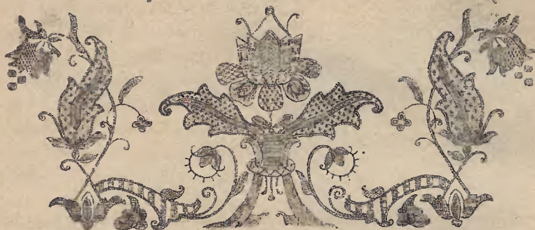
Ryc. 9. Haft biały na albie klasztornej z Żukowa.

Wartość artystyczna kaszubskiego złotogłównia tłumaczy się sama przez się. Rozplanowanie ornamentu wykonane prosto, a wykwintnie. Stosunek haftu do tła utrzymany w sposób, który znamionuje styl i smak XVIII w., jednak bez przełado-