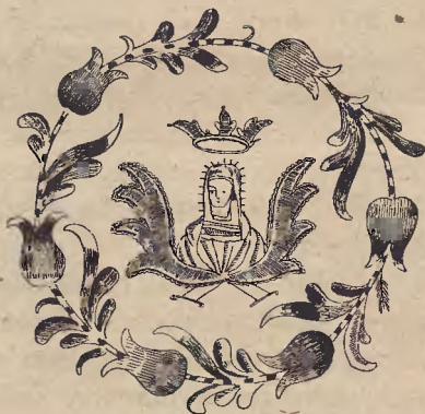
Ryc. 12. Hafciarska ozdoba paramentu kościelnego z Żukowa. (Muzeum wiejskie we Wdzydzach).

która w XVII i XVIII w. rozszerzyła na całą Europę modę noszenia tureckich pantofli z aksamitu, haftowanych złotem nićmi w zwoje liści, wyrastających z kwiatu. Podobne pantofelki dam dworskich z czasów Ludwików oglądać można w Muzeum Cluny w Paryżu. Ponieważ zaś pierwotnie, w XV i XVI w. złotogłów czyli altembas na suknie sprowadzano ze Wschodu, a dopiero później z Włoch i Francji, z Genui, Lukki, Florencji i Lugdunu 2) , przeto w czasach kształtowania się typu czepka kaszubskiego przewagę, jak sądzę, miały w hafciarniach naszych wpływy zachodnie. Guzy z naszymi dętkami t. j. różnobarwnymi,