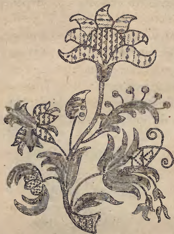
Ryc. 11. Motyw zdobniczy na albie klasztornej w Żukowie.

Obok włoskich wpływów dadzą się w ornamentyce czepków zauważyć wpływy tureckie i francuskie. Już Gołębiowski, mówiąc o haftach polskich wogóle, zaznaczył, że „Francja