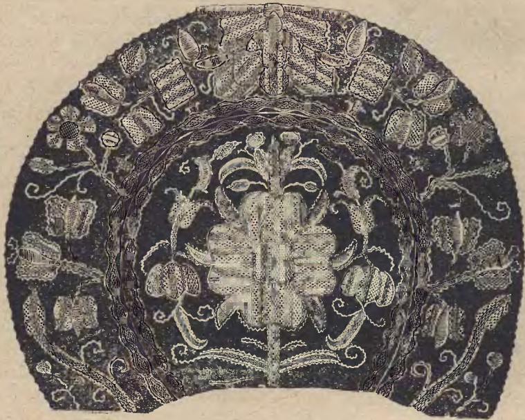
Ryc. 2. Czepek kaszubski (Muzeum wiejskie we Wdzydzach.)

Tło złotogłowa było różne: z zielonego, ultramarynowego lub spęzłło-ceglastego (róż Tycjana) jedwabiu lub aksamitu, na