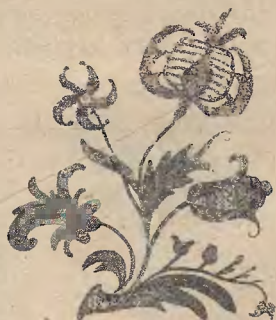
Ryc. 10. Hafciarska zdobina na albie w klasztorze żukowskim.

Typ czepków kaszubskich kształtować mogły wpływy rozliczne. Faksimilia drzeworytów Antoniego Möllera 1) wykazują, że z końcem XVI w. w Gdańsku — i wogóle w Europie — panującą modę nadawał strój hiszpański. Wtedy to, zdaje się, denko renesansowe wraz z włoskim ornamentem złotoszytym rozpowszechniło się wśród pomorskich szlachcianek. Do niedawna jeszcze włoski strój wieśniaczek z okolic Caserty cechowały chustki, haftowane w duchu, który jest bardzo bliski „kaszubskiemu złotogłówniu“. A w Museo Artistico-Industriale w Rzymie znajduje się aksamitna tkanina (veluto) z XV w., różowy atlas z rzutkami kwiatów (raso rosa con ricami di fiori) z XVIII w. oraz haftowane złotem niemi białe chustki jedwabne, których ornamentyka wykazuje wiele podobieństwa do zdobnictwa kaszubskich haftów i żukowskich alb.