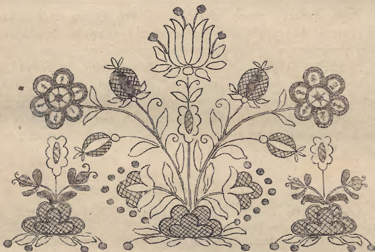
Ryc. 18. Haft srebrny na czarnej sukni. (projekt p. T. Gulgowskiej z Wdzydz)

Ornament rozciąga się albo szeroką lamówką wzdłuż boków prostokątnego płótna, albo wypełnia narożniki (obrusy,