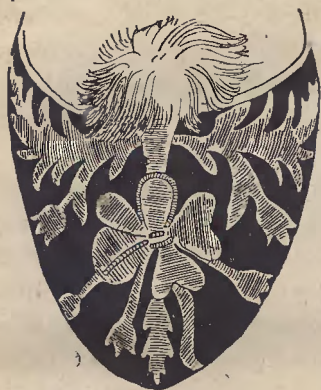
Ryc. 14. Ozdoba na mesztach haremowych sułtanek. (Muz. Przemysł. w Krakowie).

szlacheckie i mieszczańskie, na naukę bojaźni Pana, czytania, pisania i szycia (haftowania), czego zobowiązują się nauczać pilnie i gorliwie, wierząc, iż zasłużą na wdzięczność uczciwych ludzi 1) . W szkołach tych zakonów uczyły się dziewczęta haftować, a roboty ich rozchodziły się po całym Pomorzu, zarówno po dworach pańskich, kościołach, domach mieszczańskich, jak i później „po checzach“.