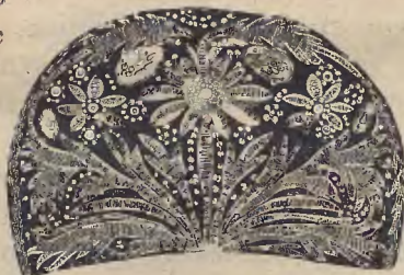
Ryc. 15 Złotem haftowany czepiek mieszczki krakowskiej z końca XVII wieku (Muzeum Przemysłowe w Krakowie).

Po rozbiórze Polski w 1772 r. sekularyzował rząd pruski oba żeńskie klasztory na Kaszubach. Dobra ich rozkupiono, albo przeobrażono na domeny królewskie, wyznaczwszy mniszkom dożywotnią pensję. Z roku na rok malała liczba zakonnic. W r. 1835 skasowano klasztor żukowski, przeobraziwszy go na parafję. Ostatnia przeorysza,