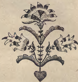
Ryc. 13. Narozna ozdoba na paramencie kościelnym z Żukowa. (Muzeum we Wdzydzach).

Także w bogatym klasztorze panien benedyktynek w Żarnowcu (pow. pucki) służyły zakonnice z rodu Sapiehów, Wessłów, Pobłockich, Gawińskich, Tempskich, Chmielińskich i t. p. Między klasztorem norbertanek w Żukowie, a benedyktynkami żarnowieckimi istniał stały kontakt. Dowodem tego jest pismo, wystosowane w r. 1561 do magistratu m. Gdańska przez benedyktyнки żarnowieckie i norbertanki żukowskie. Ogłasza ono, iż do obu klasztorów przyjmuje się dziewice, dzieci dobrych ludzi,