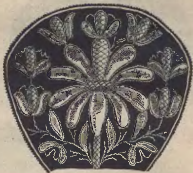
Ryc. 5. Czepek kaszubski.

Ornament czepków wykwiata z przysadkowatej łodygi (ryc. 3, 4, 5) i rozwija się ze środka denka, z dużego kwiatu rozrasta się bujnie na boki ku skroniom, wypełniając aksamitne tło gęsto usianymi zdobinami. Również tył głowy czyli środek opaski, otaczającej denko, posiada główną zdobinę, uprzywilejowaną w rozmiarach. Materiał wypukłego haftu przemawia przeciw lek-