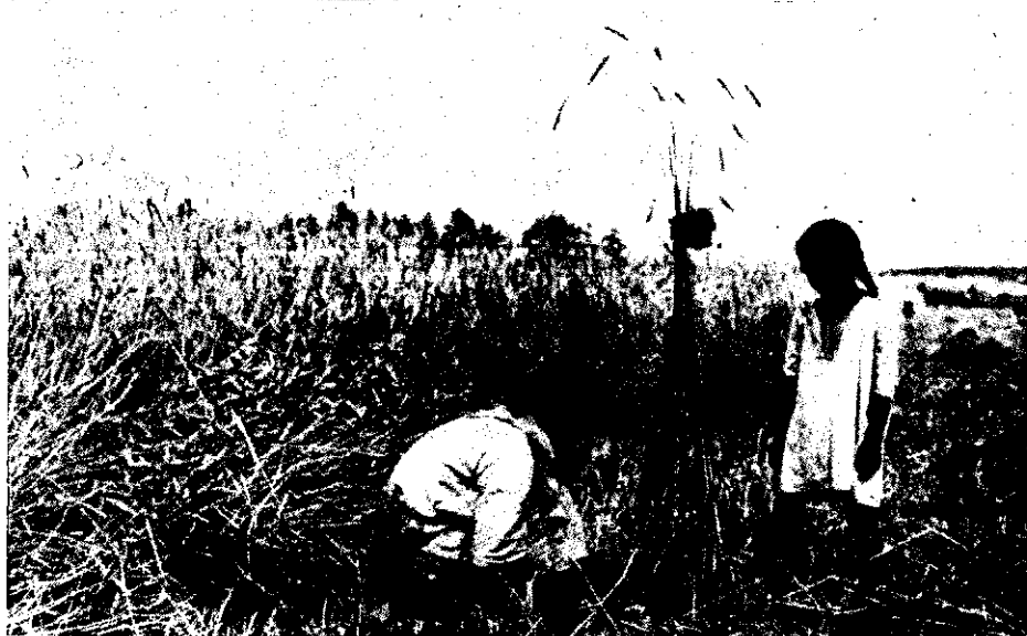
Ryc. 1. Dylewo, pow. Ostrołęka. Przepiórka