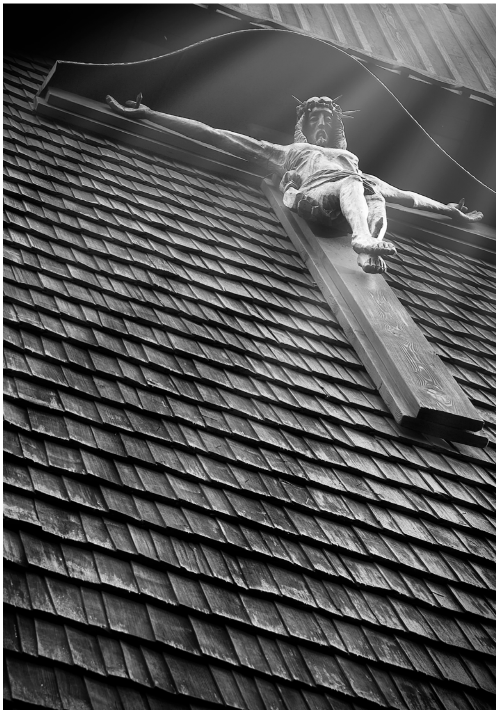
Fot. 1. Dariusz Łyżbicki, Z wysokich beskidzkich groni spogląda na kręte ścieżki tej ziemi. Pod jego fraszliwym spojrzeniem, z różności i odmienności powoli rodzi się jedność