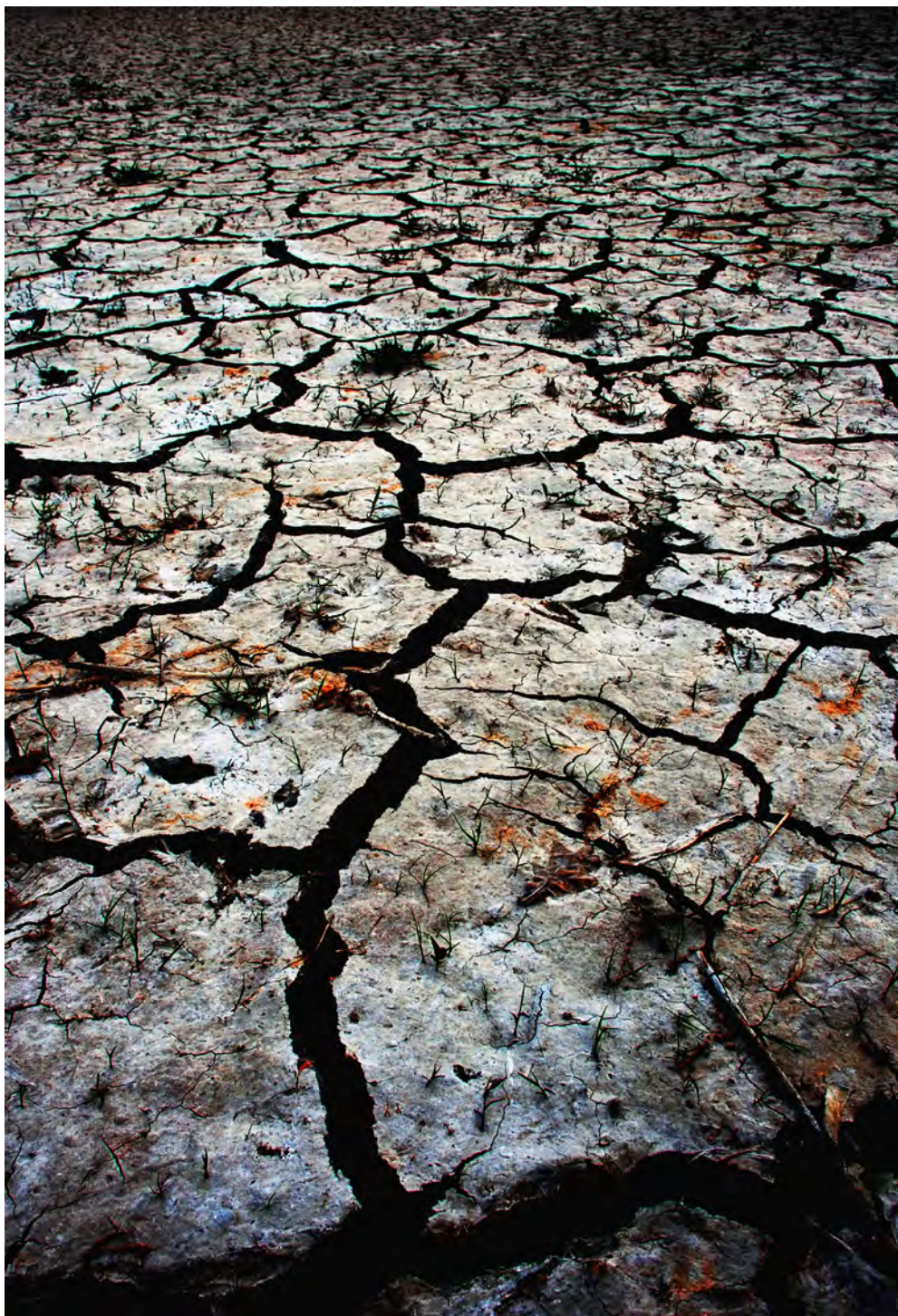
Fot.9. Radosław Krzempek, Wyschnięty staw