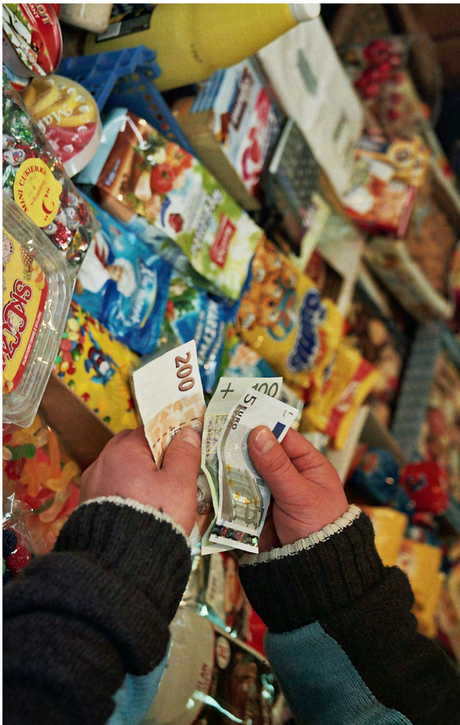
Fot.6. Marcin Chrusciel, Przejawy Europy