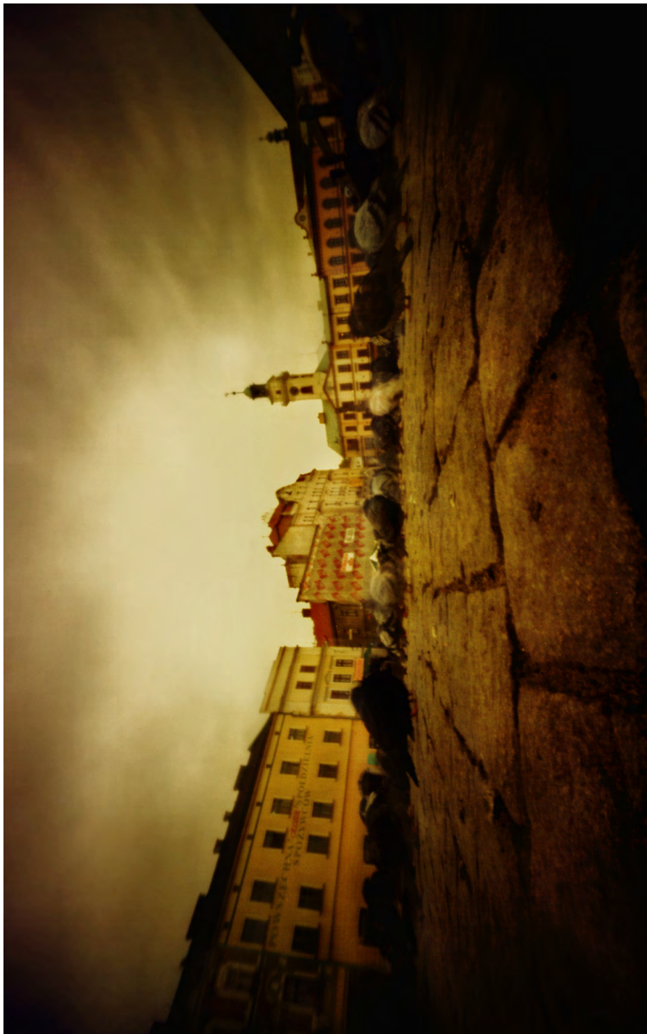
Fot.3. Tomasz Pulsakowski, Rynek w obkurcze