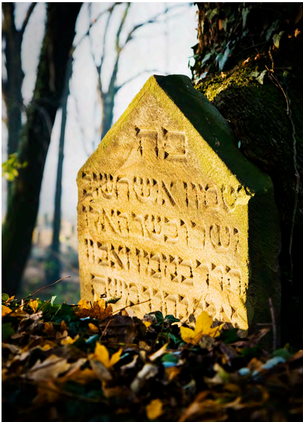
Fot.2. Dariusz Łyżbicki, Sponiewierani przez historię, przez lata zapomniani w sąsiedztwie gwarnej codzienności, cicho wrastają w pejzaż cieszyńskiej ziemi, przypominając kamiennym milczeniem, że oni z niej wyrosli