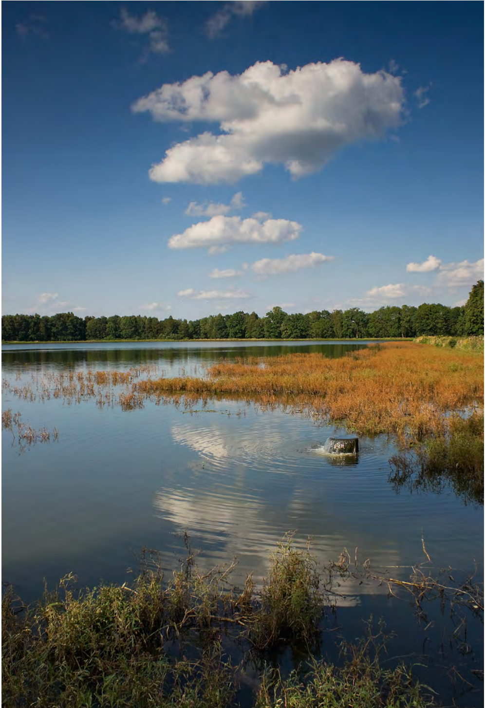
Fot.14. Piotr Kulisz, Stawy w Gołyszu