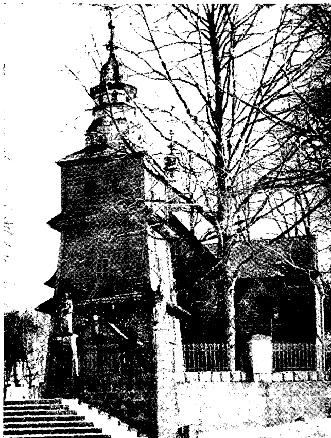
Il. 4. Wieża kościoła w Trzemesni, pow. Myślenice

W kościele w Trzemesni wieloboczne prezbiterium jest również niższe od nawy (Il. 1) co powoduje że układ kalenicy obydwu dachów jest dwupoziomowy podobnie jak w Zakliczynie. Elementem dominującym nad całością budynku jest w Trzemesni wieża o ścianach nachylnych, z pozorną