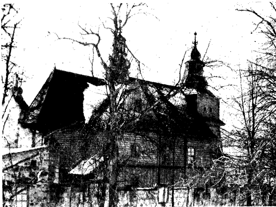
Il. 1. Kościół drewniany w Trzemeśni, pow. Myślenice. Elewacja północna.