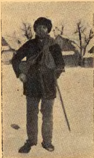
Ryc. 3. Dziubek