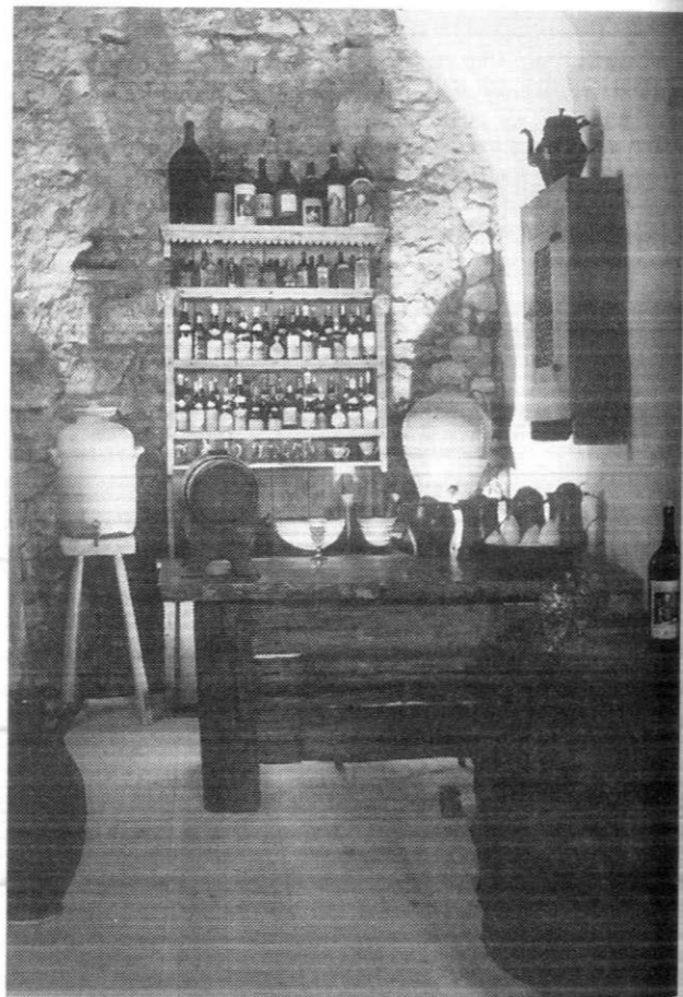
Winiarnia przy ul. Grodzkiej

Miałem już wybrane miejsce, śliczną chałupę, tuż przy drodze, ale nie starcza mi środków na tę realizację. Szukałem innego miejsca. To musi być przy wielkiej arterii komunikacyjnej. Przeniosłem tam parę chałup. Zrobi się zajazd, jak dawny kilka pokoi noclegowych, świetną restaurację, obok kuźnię. Może będą tam koronczarki, może snycerze, rzeźbiarze. Żywy pokaz rękodzieła, praca dla wybitnych artystów, i sprzedaż, kontakt bezpośredni, rzeźbiarz-klient. To musi żyć, samofinansować się. Tak jak w Grinzingu, pod Wiedniem. Trochę jak w Sztokholmie. Zresztą wiesz to dobrze, byłeś przecież w takich miejscach na świecie. Tylko że u mnie to, co autentyczne, takim zostanie, oto bądź spokojny!