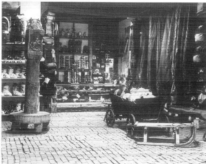
Sklep „Olimp” przy ulicy Św. Tomasza