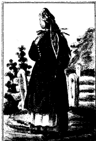
Mieszczanka z Krosna