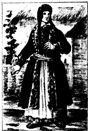
Mieszczka z Jaroslavia