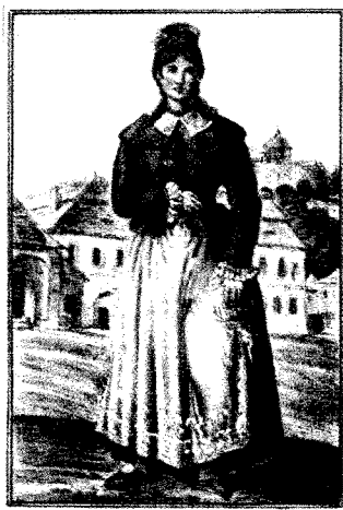
Dziewczynyna z Pińczowa