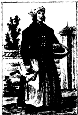
Przekupka z przedmieścia Krakowa