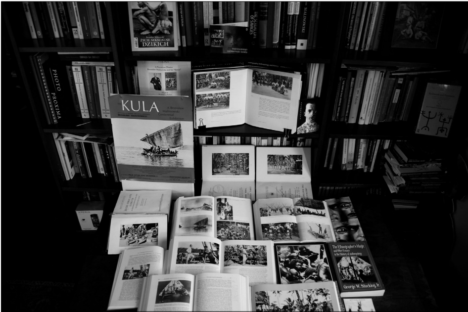
Fot. 1. Asamblaż fotografii terenowych Malinowskiego reprodukowanych na papierze, biblioteka autorki.

„Polska Sztuka Ludowa. Konteksty”, w którym opublikowano między innymi kilka tekstów o fotografii Malinowskiego (Wright 2000; Young 2000; Sikora 2000).