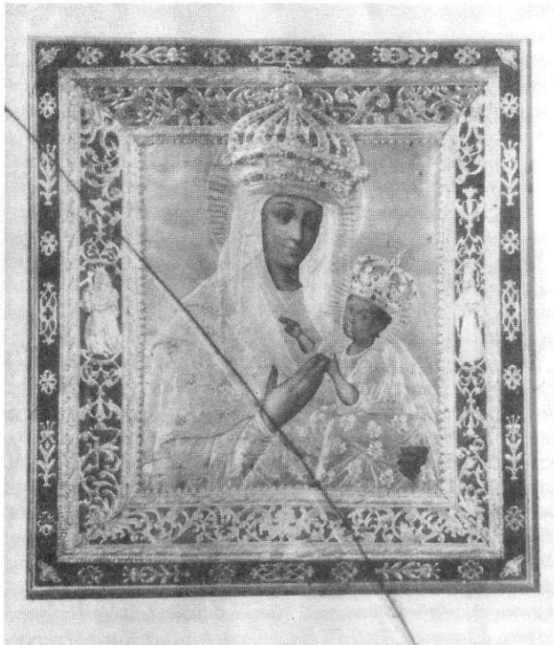
Matka Boska Budzławska

było za wydarzenie cudowne. W zderzeniu z interpretacją, według której jest to tylko proces chemiczny, rodzi się sprzeczność, z którą trudno sobie poradzić. Niemożność jednoczesnego postrzegania takiego wydarzenia w kategoriach cudu i w kategoriach pseudonaukowych pogłębia poczucie niespójności wizji współczesnego świata. Obrazy. Aha. To było tak, że odnawiali się. Teraz u nas w kościele przynieśli (...) i teraz Matki Boskiej obraz jest w Widzach, w kościele. (...) Adnawil się, nauka tam dakazywała, że tam jest takie materiały, substancje. Jaka reakcja idzie. Ja liczę, że to więcej jest cud święty, a co tam nauka dokazuje to jeszcze nic nie dokazali (Białorusin). Doświadczenie sacrum niełatwo poddaje się racjonalizacji, a próby podejmowane w tym kierunku kończą się czasem uznaniem własnej niemożności. Znaczenie odnawiania się obrazów może być zrozumiane tylko w kontekście sacrum . Odarcie zdarzeń cudownych z tego, co najważniejsze, co nadaje im sens, musi budzić niepokój i niepewność. Dlatego też znany z gazet i wspominany często opis objawienia się Matki Boskiej na szpitalnym oknie zawsze jest zaliczany do cudów.