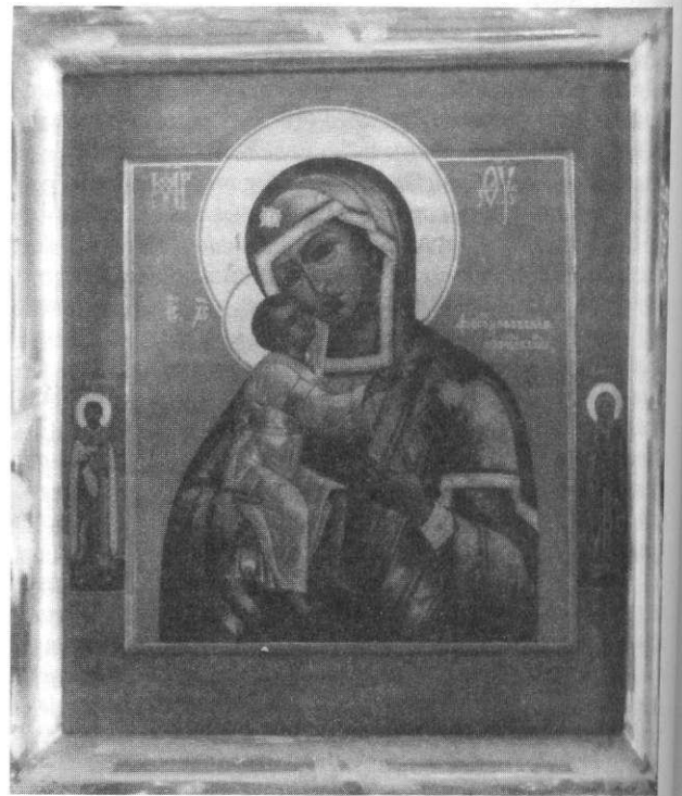
Matka Boska Fiodorowska