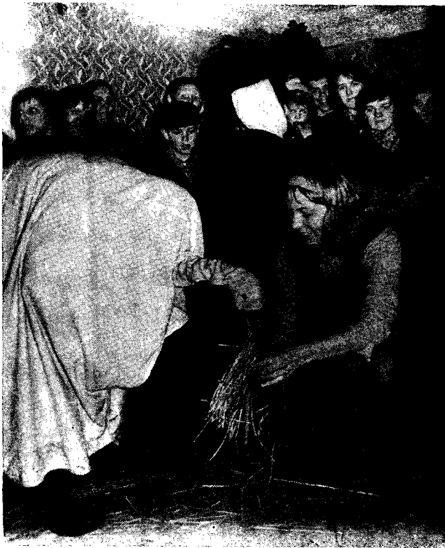
Il. 2. Bocian zjadający słomę, co ma zapewnić urodzaj, Poraj, gm. Gorzkowice, woj. piotrkowskie