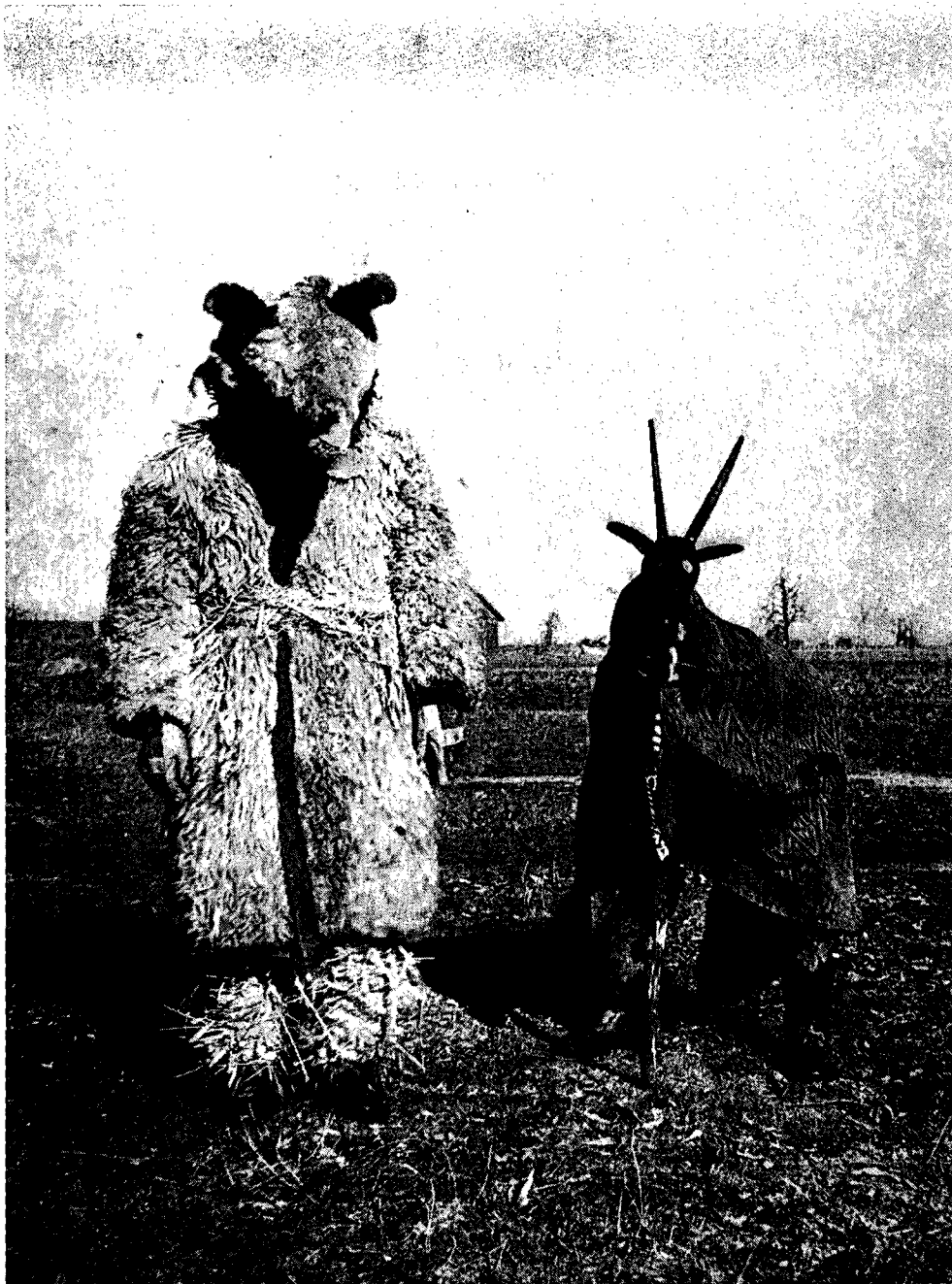
Il. 13. Przebierańcy: niedźwiedź i koza, Poraj, woj. piotrkowskie

stem sobie król Melcher z zachodniego kraju" 148 . A więc jedynie królestwo Heroda jest tak wyjątkowe.