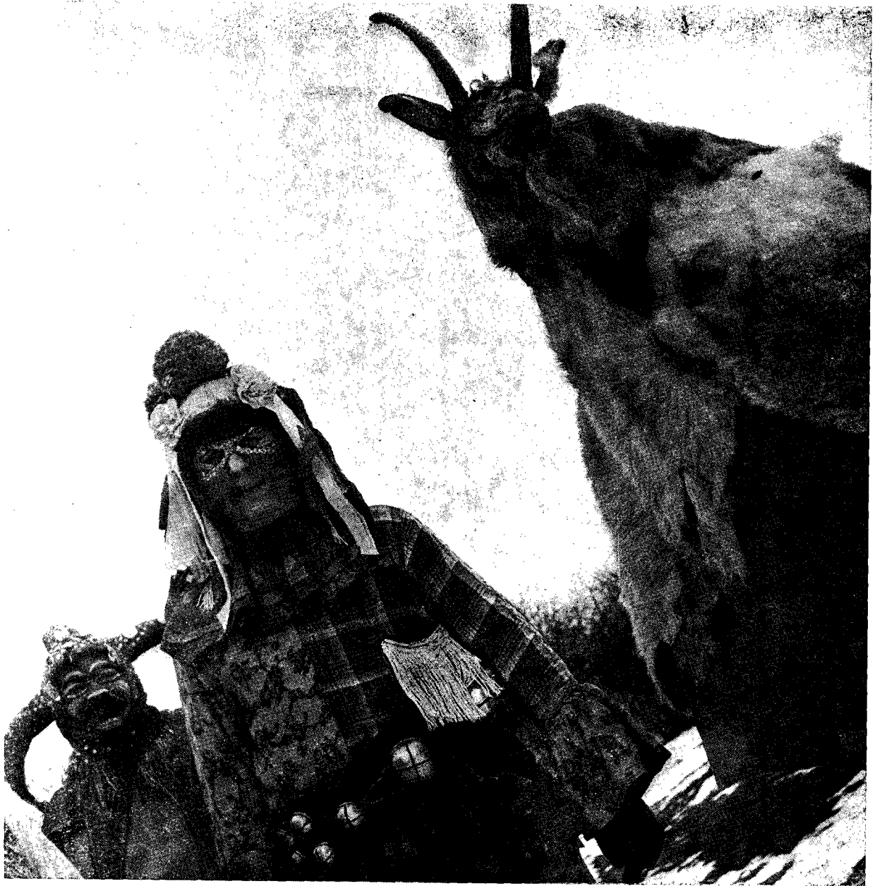
Il. 4. Maski, Dziady i Szlachcice, Laliki

Chodzi tu o różne formy zaczepiania dziewcząt, a nawet i zamężnych kobiet, wykonywane zresztą tylko przez wymienione maskary-zwierzęta lub dziada . Rzadziej spotyka się symulację kopulacji 36 , częściej różne bodzenia, podszczypywania, poklepywania, pocałunki, gonitwy, przewracania etc. Wydaje się, że ten drugi ro-