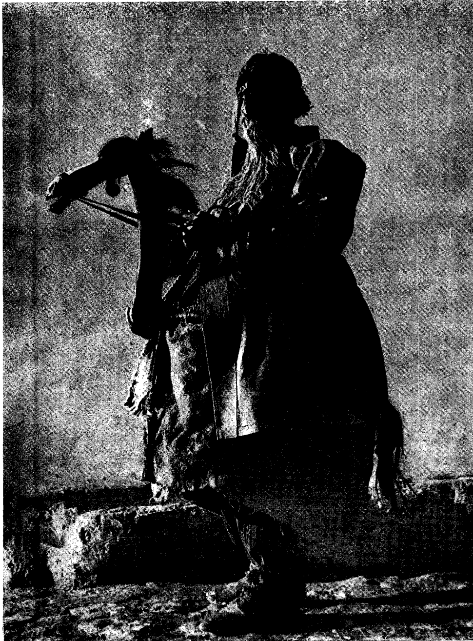
Il. 14. Żyd na koniu z grupy herodów. Pruchnik, woj. przemyskie

— można dowieść pokrewieństwa takich postaci, jak dział i koza z takimi osobami z herodów jak żyd i diabeł ,