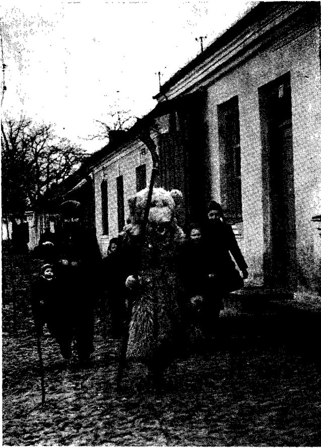
11. 6. Kusaki z niedźwiedziem, Jedlińsk, woj. radomskie