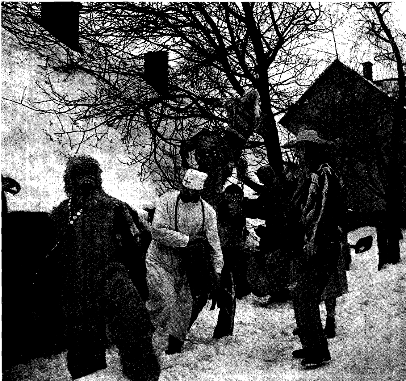
Il. 5. Scena przed chałupą, Laliki

znaczenie. Dziela się one na dwie kategorie: czynności i rekwizyty. Jeśli chodzi o wybór postaci to są to te, o których miałam największą ilość informacji.