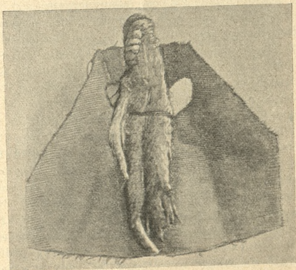
Ryc. 4. Korzeń mandragory w koszulce własność Rudolfa II.

Korzenie te czarodziejskie czyli alruny sprowadzano najwięcej z Włoch i Francji. Za najlepsze uchodziły korzenie