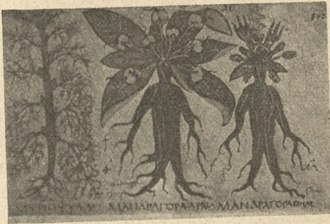
Ryc. 3. Dwie mandragory z korzeniem, liśćmi, kwiatami i owocami w kodeksie neapolitańskim

Korzeń mandragory zwali Niemcy » alraun « i » alraunwurzel «. Dla wytlómaczenia pochodzenia tego miana » alraun « przychodzi nam na myśl wyrażenie » der alles raunende «, tj. wszystko wiedzący. » Alruny « w mitologii skandynawskiej oznaczają tajemnicze istoty nadprzyrodzone płci żeńskiej (got. runa = tajemnica), których były rozmaite rodzaje. Miano to » alruny « nadawali germanowie mądrym niewiastom, posiadającym władzę wieszczenia i wywierającym znaczny wpływ na publiczne