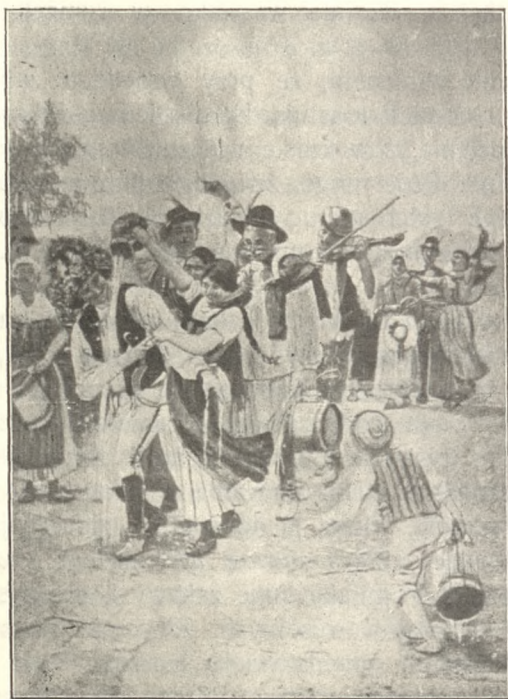
POWRÓT ŻNIWIARZY Z POLA.

„W szlacheckiej stolicy udwarhelskiej, w gminie Oroszhegy mieszkający N. N. zaprosił was przed ośmiu dniami dla uczcze-