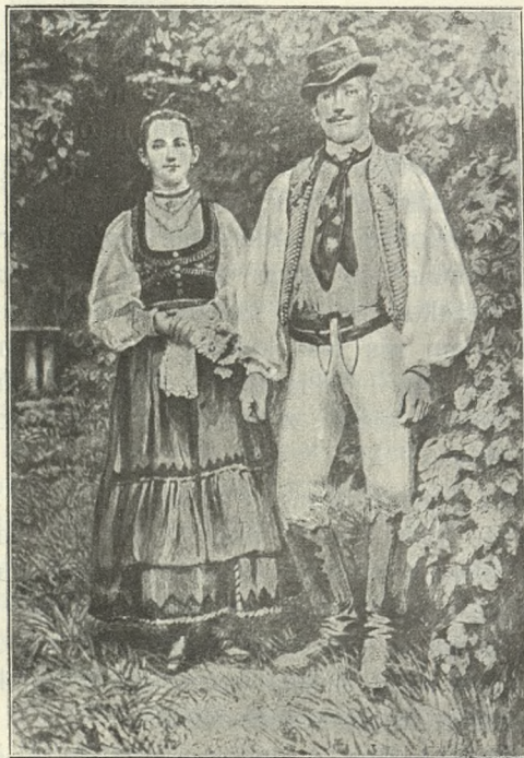
MŁODA PARA SEKLERSKA.

„Zamykam tedy moją krótką mowę, weź mnie, proszę cię, mój drogi mężu, do swego serca, do swej duszy; prowadź mnie tam, gdzie Bóg mój może moje całe życie na wieki uświęcić. Amen“.