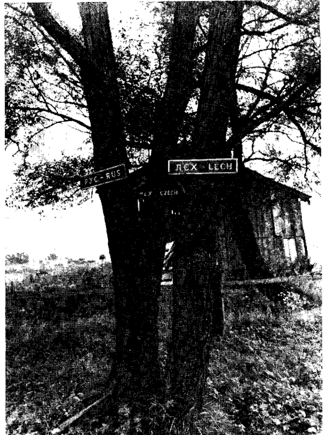
Il. 3. „Kącik braterstwa” na terenie Muzeum w Zyndranowej

w których straciły życie setki tysięcy żołnierzy różnych armii, a także wielu miejscowych. Ponurej sławy „Dolina Śmierci” między Iwłą a Hyrową, jedno z największych pobojuwisk w tej części Europy, znajduje się niedaleko Zyndranowej.