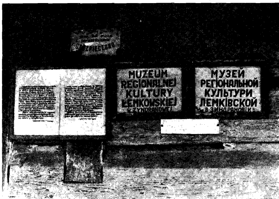
Il. 4. Tablice przy wejściu do Muzeum w Zyndranowej

Lemkowie bowiem nie zostali oficjalnie uznani jako odrębna mniejszość narodowa, lecz zaliczono ich do narodu ukraińskiego z różnych przyczyn, o których w tym miejscu pisać nie będę wielu Lemkom ów stan rzeczy nie odpowiada, ponieważ silnie odczuwają swą odrębność zarówno wobec Ukraińców, jak Polaków. To powoduje, że chociaż Ukraińskie Towarzystwo Społeczno-Kulturalne, działające w Polsce, uwzględnia także (zgod-