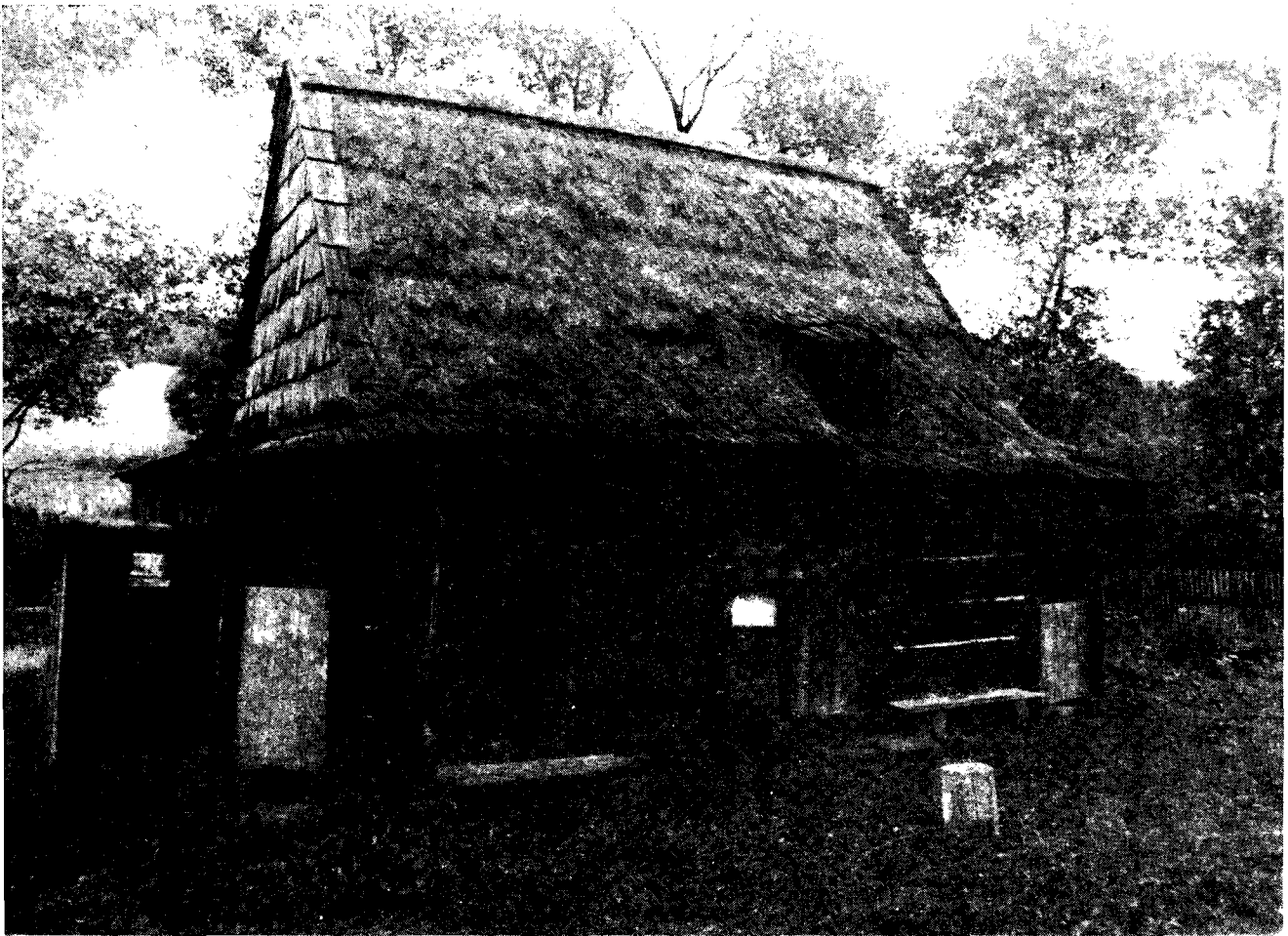
Il. 5. Zagroda muzealna, ekspozycja pamiątek wojennych

nie ze statutem) potrzeby kulturalne Łemków, to jednak nie mają oni w łonie Towarzystwa pełnych warunków rozwoju. Po prostu — czują się tam nie w pełni u siebie. Nie mam tu zamiaru rozpisywać się o relacjach łemkowsko-ukraińskich w Polsce, zwłaszcza że różnie się one kształtowały w ciągu czterdziestolecia; niemniej faktem jest, że wielu działaczy łemkowskich pozostaje poza Towarzystwem. Muzeum w Zyndranowej, działające niezależnie od UTS-K, nie jest więc, traktując rzecz urzędowo, muzeum mniejszości narodowej.