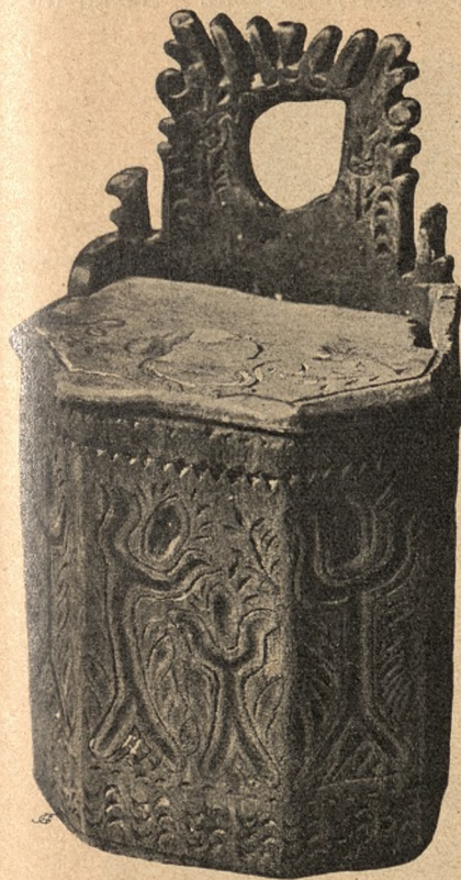
Solniczka z Szamowiec wyższych.

Już katalogi dwóch wystaw, jakie Towarzystwo urządziło: jedną w Krakowie a drugą w Warszawie w 1902 r. zwracają naszą uwagę, że sztuka ludowa na całym obszarze ziem polskich bywa z zamiłowaniem wielkiem uprawiana, jest nader różnorodna. obejmuje wszystkie objawy życia ludowego, wyciska swoje piętno na najdrobniejszych nawet przedmiotach z jego otoczenia. Widzie-