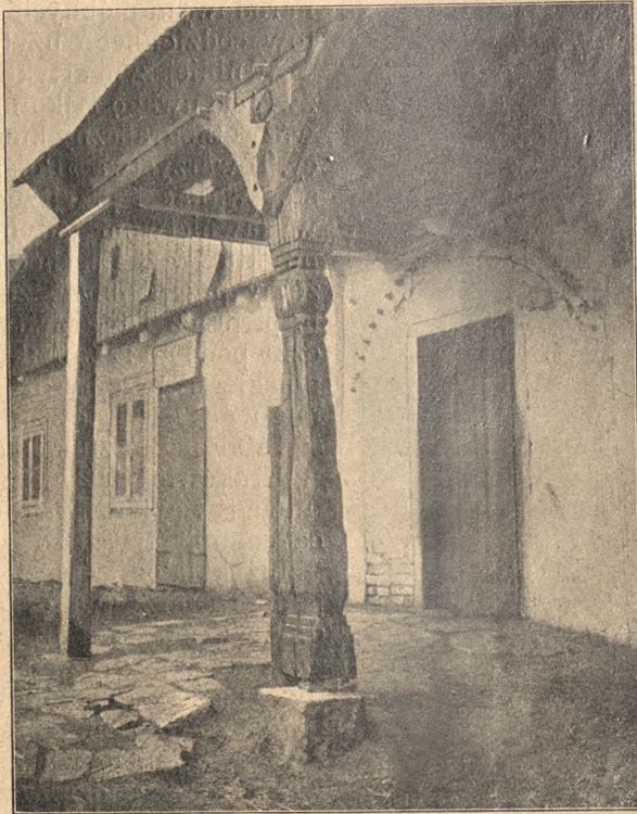
Stupy podsieniowe z Modrzejowa.

odbito czarno, a 5 tablic kolorowych bądź litograficznie, bądź też drukiem trójbarwnym wykonanych. Cynkotypie sporządzone według fotografii bardzo wyraźnie i z dokładnem oddaniem szczegółów ornamentacyjnych, przedstawiają: stół góralski z Kluszkowic, solniczkę z Szamowiec górnych, czerpak z pod Zakopanego i łyżnik z Cichego w powiecie nowotarskim. Ze Śląska austriackiego zaś mamy czerpak do żetycy i cztery uszka do