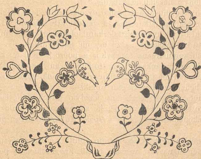
Motyw ze skrzyni z Izdebniej na Śląsku austriackim ze zbiorów J. Warchałowskiego.

W ostatnich czasach rozwinął się w krajach zachodnich ruch nader ożywiony, zmierzający do tego, aby wyrobom artystycznego przemysłu nadać odrębny a wybitnie narodowy charakter. Ludzie fachowi, artyści ujęli tę sprawę w ręce swoje w Anglii, w Niderlandach, we Francji a wreszcie w Niemczech