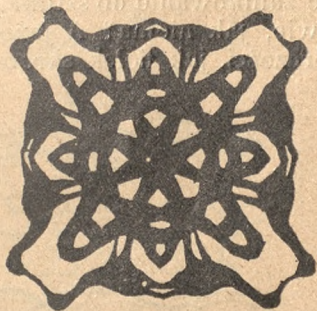
Gwiazda wystrzygnięta z papieru we wsi Miesiące.

Trzeba było rozpatrzyć się dobrze, czy nie pozostał ślad jakiejś tradycyi, odnoszącej się do wyrobów artystycznego prze-