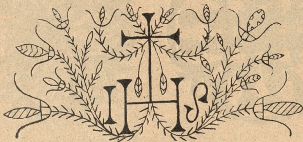
Motyw z łyżnika podhalskiego.

Była to sprawa dla nas w ogóle bardzo doniosła, dla przemysłu naszego w całym tego słowa znaczeniu żywotna, bo usi-