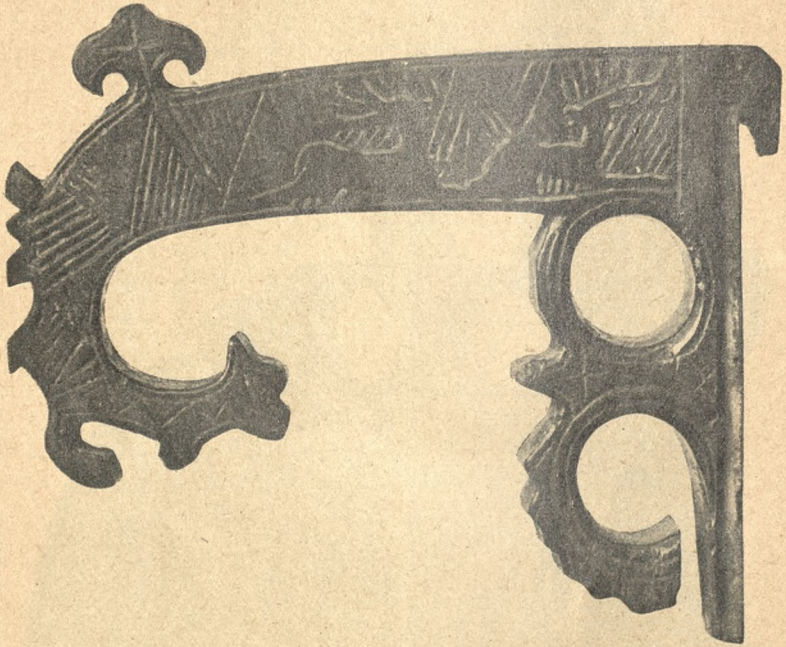
Ucho do czerpaka z Beskidów na Śląsku austriackim ze zbioru J. Warchałowskiego.

Zeszyt II. zawiera także siedm tablic, to jest 3 czarne i 4 kolorowe. Czarno odbite są dwa łyżniki z Dzianisza i z Witowa w powiecie nowotarskim, solniczka, czerpak do żętycy i dwa uszka do czerpaków ze Śląska austriackiego. dworek z Malinowa, słupy podsieniowe z Modrzejowa i dom drewniany w osadzie Czeladź w powiecie będzińskim, a wreszcie słup pod-