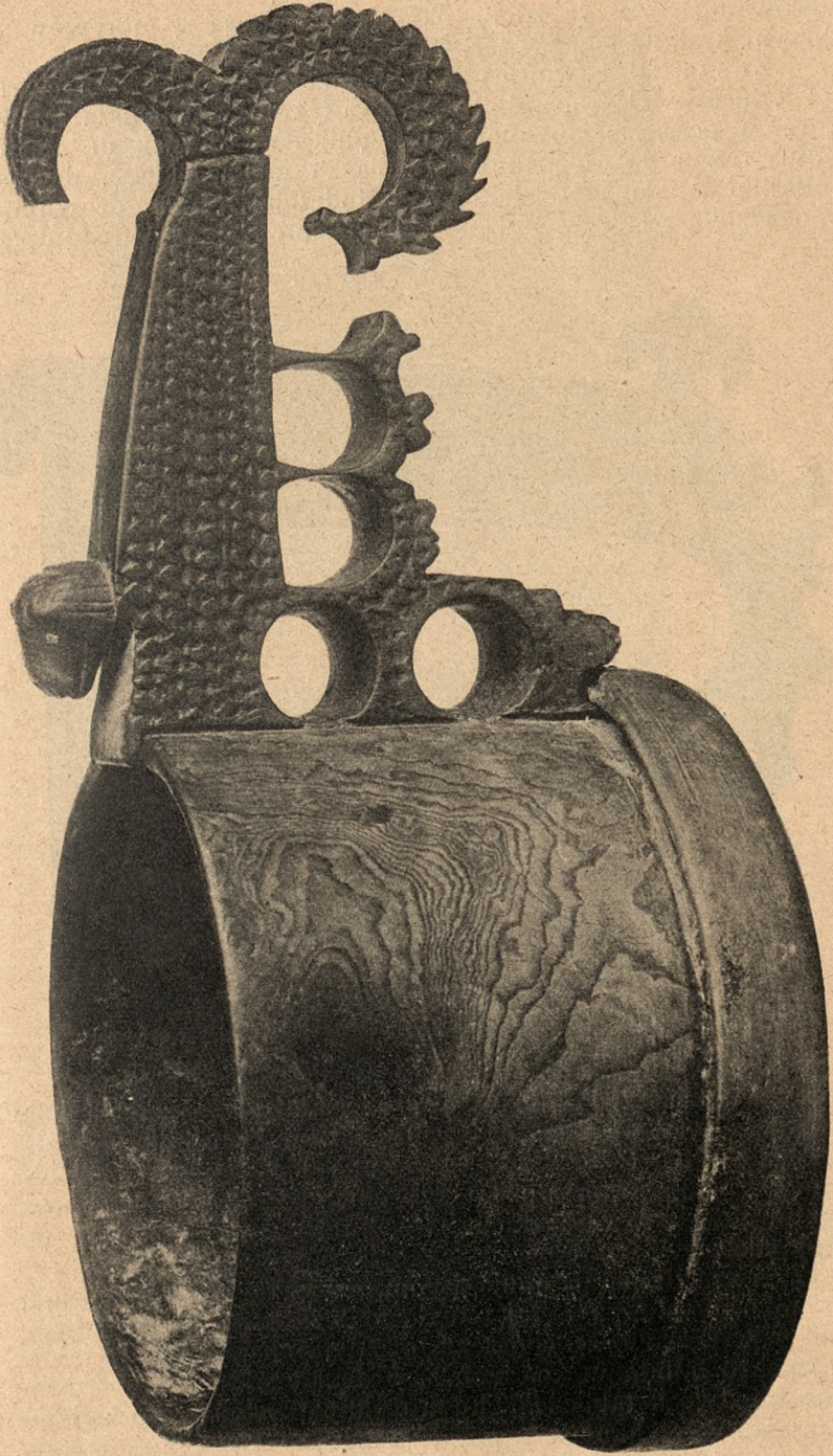
Czerpak do żętycy z Beskidów na Śląsku austriackim ze zbioru J. Warchatowskiego.