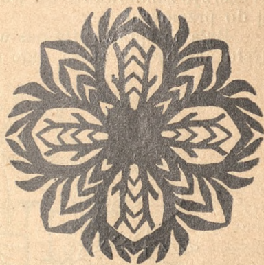
Gwiazdy wystrzygnięte z papieru we wsi Miesiące.

gniemy gorąco otrząść się z tych wszystkich naleciałości, które zagrażają naszej odrębności narodowej.