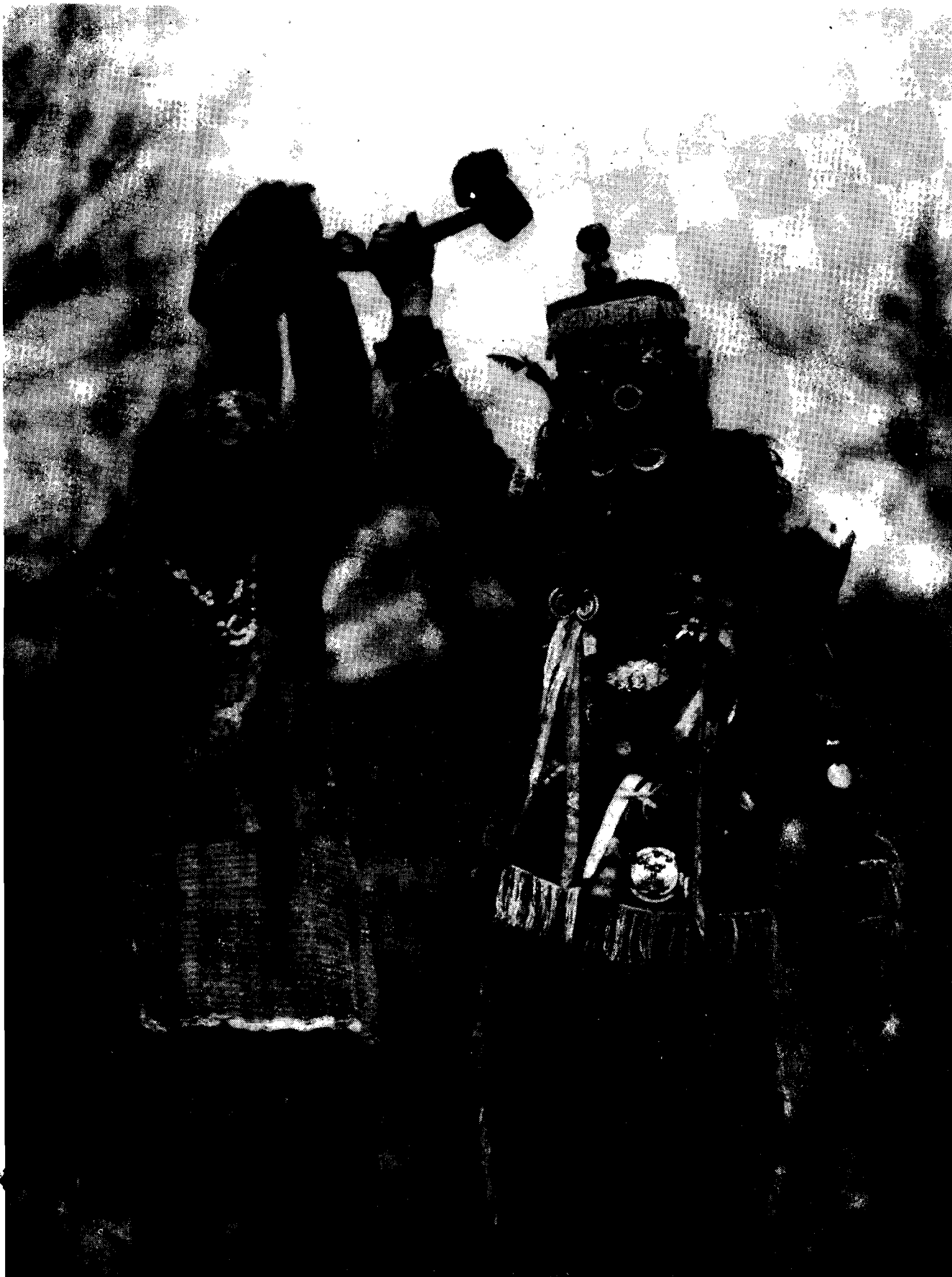
Il. 4. „Dziady”, Zwoln k. Żywea