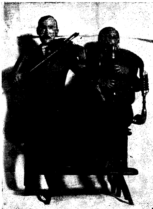
Ryc. 3. Dudziarze. Polichromowana rzeźba w drzewie. Wys. 30 cm. Ok. 1948 r.