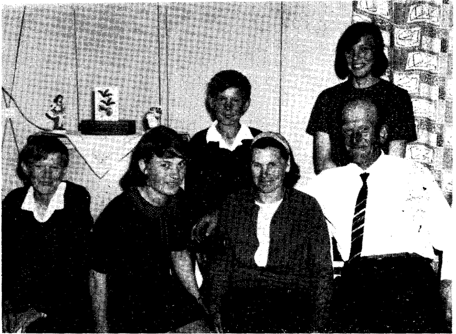
Ryc. 2. Rodzina chłopska pochodząca z powiatu Nowy Sącz. Ołobok pow. Świebodzin, 1965.

rali małżeństwa międzygrupowe w 41 0 / 0 , Lemkowie, grupa pomawiana o szczególnie izolacjonizm z racji odmienności etnicznej, w 53 0 / 0 . Szczególnie częste na terenie tej wsi były małżeństwa nowogrodzko-poznańskie (11 małżeństw). Dziewczęta wśród Poznaniaków zawierających małżeństwa międzygrupowe stanowiły 31 0 / 0 , wśród Lemków 44 0 / 0 , Nowogrodzian