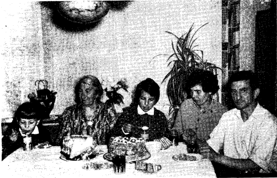
Ryc. 1. Rodzina robotniczo-chłopska oparta o małżeństwo międzygrupowe. Mąż i jego matka pochodzą z województwa poznańskiego, żona z wileńskiego. Ołobok pow. Świebodzin, 1965.

w pow. Świebodzin, Santoka w pow. Gorzów i Stołunia w pow. Międzyrzecz. mówią o stałym wzroście odsetka małżeństw heterogamicznych. Wzrost ten nie był jednakże równomierny. Można wysunąć tezę, która wymaga jednakże zweryfikowania na podstawie poszerzonej bazy źródłowej, że po pierwszym rocznym czy dwuletnim okresie spontanicznych kontaktów, popartych wspólnymi dla rodzin polskich doświadczeniami