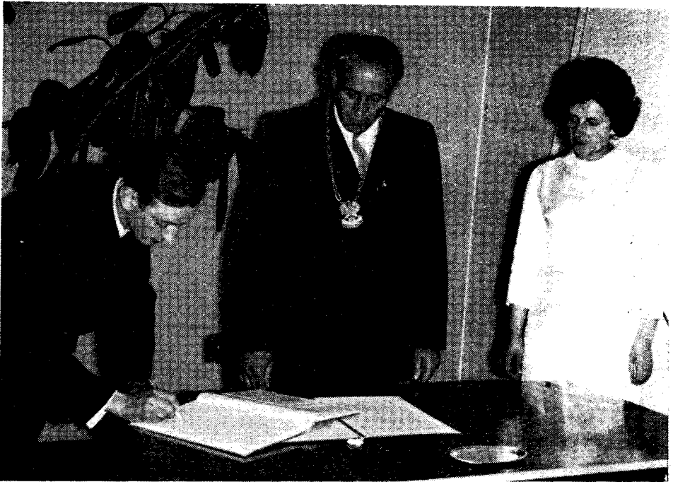
Ryc. 3. Ślub w Urzędzie Stanu Cywilnego. Santok pow. Gorzów, 1967.

trwałość wykazuje np. obrzędowość Bożego Narodzenia, z zachowanymi u wielu rodzin regionalnymi sposobami obchodzenia Wigilii, w czasie której podawane są tradycyjne potrawy.