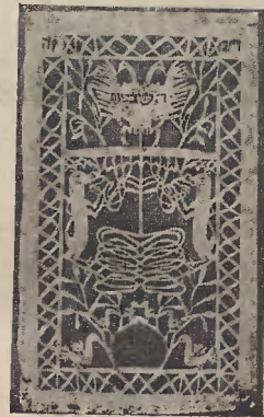
Ryc. 27. Szewuosł.

Ponieważ chorągiewka przedstawiać ma godło jednego z dwunastu pokoleń żydowskich, nosi zazwyczaj odpowiedni napis: „degel machne Jehuda lub Efraim“ i t. d. — „chorągiew obozu Judy lub Efraima“ i t. d. Także — i to