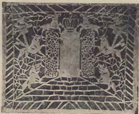
Ryc. 33. Szewuosl.