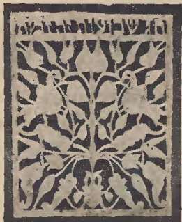
Ryc. 28. Szewuost.

Z motywów centralne miejsce zajmuje zazwyczaj Tora, odpowiednio do święta, które wyrażać ma radość z powodu jej posiadania. Nad Torą rozpięta jest zwykle korona, zaopatrzona nie rzadko w napis „keser Thora“ — „korona Tory“. Torę podtrzymują najczęściej lwy i wtedy chorągiewka jest sztandarem Judy. Czasem jednak zamiast lwa mamy inne motywy, odpowiadające godłom innych pokoleń. Chorągiewka jest dwustronna i daje dlatego dość miejsca dla rozmieszczenia motywów. I tak np. na jednej stronie umieszcza się Torę z koroną i napisem: „Sisu w'simchu i t. d.“, a na drugiej godło pokolenia i napis „degel machne i t. d.“ 1) . Dobór motywów jest zresztą dowolny i często bez szczegó-