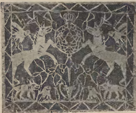
Ryc. 30. Szewuost.

Ornament wycinankowy wykazują także tablice z wypisem daty śmierci bliskich osób, sporządzane w niektórych rodzinach dla dokładnego zapamiętania tych dat.