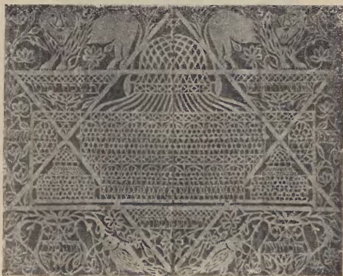
Ryc. 22 Mizrach.

Zaznaczyć tu jednak należy, że twórcy wycinanki bardzo często nieświadomie tworzą motywy, nie zastanawiając się zupełnie nad ich genezą. O napisach zupełnie nie myślą, lub ich nawet nie znają. Pewne motywy wycinają dlatego, że takie właśnie, a nie inne są rozpowszechnione. Jest to zresztą rys charakterystyczny dla twórczości ludowej w ogólności. — Często spotykamy tylko poszczególne ze wspomnianych powyżej motywów zwierzęcych. Nasuwa się tu pytanie: Jeśli któryś z tych 4-ch motywów spotykamy odosobniony, czy genezy jego należy doszukiwać się także w powyższym cytacie, jako tak często na