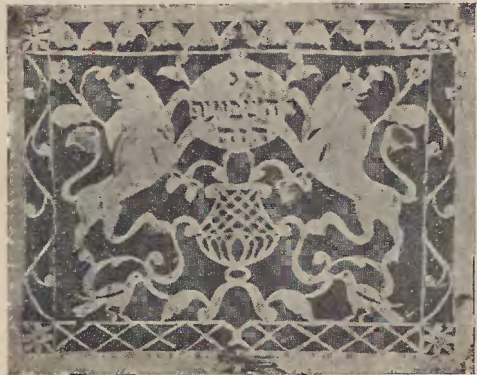
Ryc. 32. Szewuosł.

blice od pierwszego wyrazu napisu popolicie nazywają — wycięta też była ryba, mazel dagim, jako gwiazdozbiór odpowiadający miesiącowi adar. W niektórych bożnicach jeszcze po dzień dzisiejszy takie miszenechnas wywieszają, ale są to już przeważnie tylko napisy, albo tanie druki. W święto Sukoth wywieszano często w szałasie tablicę, tak zwaną „Uszpizin“, zdobną czasem także w wycinankę. „Uszpizin“ oznacza „gości“, których — wedle księgi Zohar — jest 7-miu: Abraham, Izak, Jakób, Józef, Mojżesz, Aron i Dawid. Ich wszystkich zaprasza się kolejno podczas siedmiu dni święta Sukoth do współdziału w biesiadach. Formułę zaproszenia wypisywano na papierze i zawieszano w szałasie, by ułatwiać jej odmawianie.