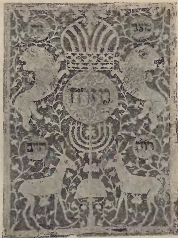
Ryc. 23. Mizrach.

Niektóre mizrachy składają się jakby z 2 części, umieszczonych jedna nad drugą, a oddzielonych linią poziomą 4) . (ryc. 19).