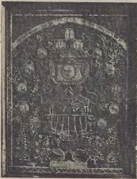
Ryc. 24. Mizrach-Sziwis'i

Należy jeszcze zwrócić uwagę na ludowy sposób ujmowania motywów. Spotyka się np. czasem lwy, które niezupeł-