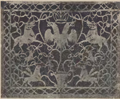
Ryc. 31. Szewuosł.

flaszkę i kieliszki, jako — aż nazbyt wyraźny — symbol tej radości i wesela. Czasem na takim miszenechnas — tak te ta-