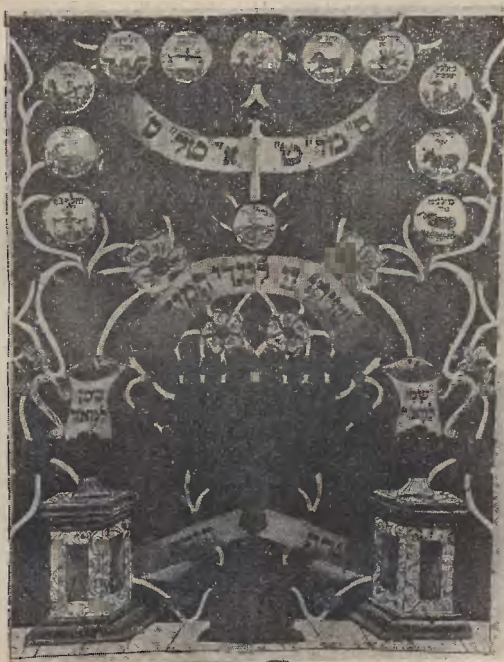
Ryc. 21. Mizrach-Sziwis'i

ramienny, menora, który był jednym z ważnych przedmiotów urzędzenia świątyni (ryc. 19, 20, 21, 23, 24). Nad tablicami przymierza widzimy często koronę (ryc. 20, 23), czasem tarczę Dawida. Dokoła takiego centralnego motywu grupują się motywy zwierzęce, roślinne oraz ornamenty geometryczne. Na pierwszy plan wysuwa się motyw zwierzęcy, który należy zazwyczaj także do ilustracji treści, natomiast roślinny, względnie rzadszy geometryczny służą do ornamentyki. Ze świata zwierzęcego spotykamy