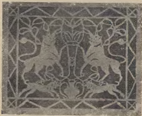
Ryc. 34. Szewuosł.

ludzie starsi. Szewuosłach sporządzały dzieci i młodzież w chederze, także belfrzy i mełamedzi. Chorągiewki przygotowywali przed świętami belfrzy i odnosili do domów swych elewów, za co otrzymywali pewne wynagrodzenie w formie świętecznego.