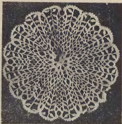
Ryc. 25. Rojzałe.

Drugim bardzo bogatym typem wycinanki żydowskiej są tzw. „szewuosłach“ lub „rojzałach“, sporządzane przed Zielonemi Świątami i naklejane na szyby okien. Przeciętą ich wielkość to wymiary kartki zeszytowej, jakkolwiek spotykamy i o wiele mniejsze rozetki, bardzo misternej roboty. Po świątach zdejmowano zazwyczaj wycinankę i przechowywano w książkach na rok następny. Tej okoliczności zawdzięczam kilka egzemplarzy, które zapomniane spoczywały w starych księgach. Mają one dwojaką nazwę. Szewuosłach od nazwy święta: Szewuoth, a rojzałach od rozetki, którą oznacza się każdy ozdobny ornament. Jakkolwiek szewuosłach i rojzałach oznaczać mają tę samą wycinankę, to jednak dają się rozróżnić dwie formy, właściwe dla tych dwu określeń. Jedna okrągła i tę oznacza się zazwyczaj nazwą rozetki 2) , druga prostokątna. Typową jest bardzo zręcznie wykonana rozetka o motywie geometrycznym, względnie geometryczno-roślinnym (ryc. 25). W ramach takiej rozetki umieszczone są często ptaki, czasem