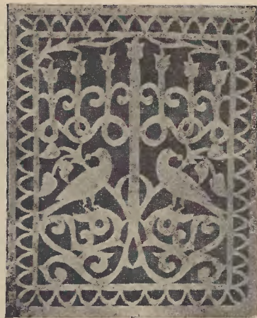
Ryc. 29. Szewuost.

Od drugiego dnia Pesach — kiedy to ongiś składano w świątyni w ofierze pierwszy snop jęczmienia — należy liczyć 7 tygodni t. j. 49 dni aż do święta Szewuoth. W tym okresie czasu, zwanym „Sefirath ha-Omer“ („liczenie omeru“, bo ta miarka jęczmienia zwała się „omer“) odmawia się codziennie po modlitwie wieczornej błogosławieństwo i liczy odpowiedni dzień omeru. Obrzęd liczenia sefiry odgrywa w kabalistyce wielką rolę i dlatego dodano przed i po tem błogosławieństwie jeszcze szereg zwrotów hebrajskich, które razem składają się na całą modlitwę. Tekst jej wypisywano na papierze i wieszano w bożnicach dla ułatwienia publiczności jej recytacji. Tablice te zdobiono czasem bardzo ładną wycinanką 1) .