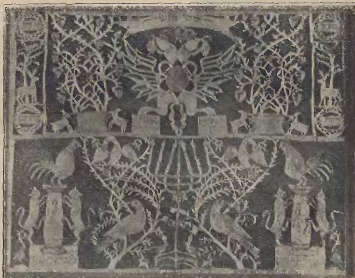
Ryc. 19. Mizrach.

lebka ludu. Bardzo częstym i dla mizrachu bardzo charakterystycznym jest cytat z Sentencji Praojców (V. 23): „Hewej az ka-namejr w'kal ka-neszer, rac ka-cwi w'gibor ka-ari, laasoth reconawicha sze-baszamajim“. „Bądź wytrzymałym, jak tygrys, a lekkim jak orzeł, rączym jak jelen, a silnym jak lew — aby spełniać wolę Ojca w niebiosach“. (ryc. 19, 20). Cytat ten wywiera silny wpływ na motywy wycinanki; bo zauważyć się daje związek między nim, a motywami zwierzęcymi, spotykanymi zazwyczaj na mizrachach. Występuje ten cytat już to w całości, już to czę-