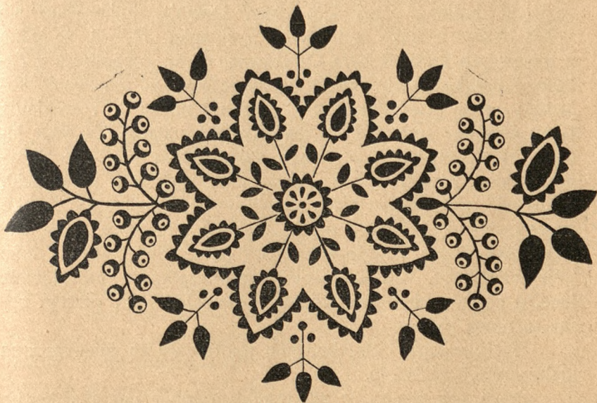
Haft wypukły na poduszce ze wsi Wola Żelichowska (pow. Dąbrowski), rys. z oryg. Wł. Hickel,

Zamiłowanie do robót ręcznych musi tu być wielkie, skoro niemal wszystkie dzieci noszą na codzień koszulki, zapaski i krezki pod szyją bogato haftowane kolorową bawełną. Dorośli noszą koszule haftowane na kołnierzu, na piersiach i na zakończeniu rękawa. Zapaski i spódnice są niemal całkiem pokryte haftem. Najpiękniejsze są chustki (czepce); — wreszcie