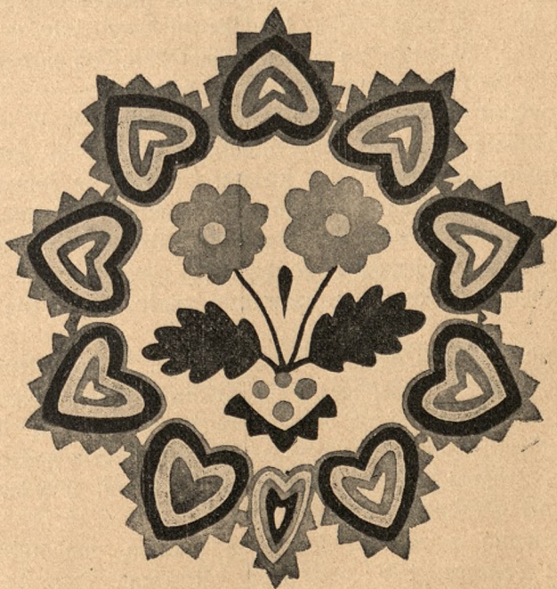
Malowanka, wykonana przez B. Kawę, z oryg. rysował Wł. Hickel.

Do trzeciego typu, znacznie rzadszego, należą kompozycje w kole. Ponieważ podobnych haftów (prócz kilku kresek) tutaj nigdzie nie dostrzegłem, sądzę, że jest to wpływ wycinanki, która w tych stronach zawsze bywa komponowana w kole. Są to najoryginalniejsze malowanki ze wszystkich, a składają się z dwóch części: z obwodu, zazwyczaj bardzo szerokiego i ze środka. Obwód składa się albo z kółek obok siebie malowanych albo też ze ząbków. Szersze obwody mają już to formę gerlandy z kwiatów, między którymi sterczą po dwa listki, już to składają się z figur, kształtem podobnych do geometrycznego rombu i serc obok siebie leżących.