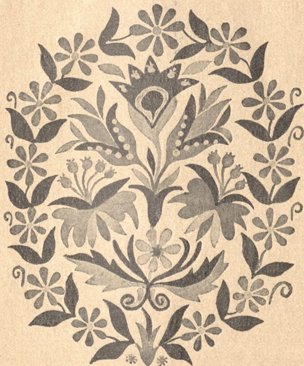
Malowanka wykonana przez B. Łatę, skopiował Wł. Hickel.

Zamożni gospodarze posiadają obok wspólnej izby, kuchni i komory częstokroć oddzielną izbę, w której przez dzień nie mieszkają. Miło wejść do tej schludnej izby.