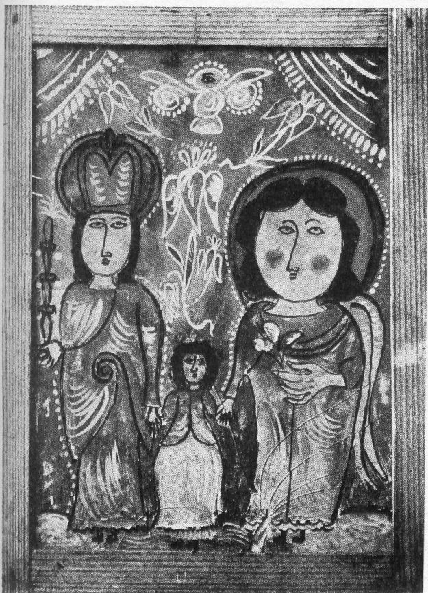
Il. 9. Kapliczki ze zbiorów Zb. Kowalewskiego. Il. 10. Św. Rodzina , obraz na szkle, wym. 40x29 cm, wyk. Zb. Kowalewski.