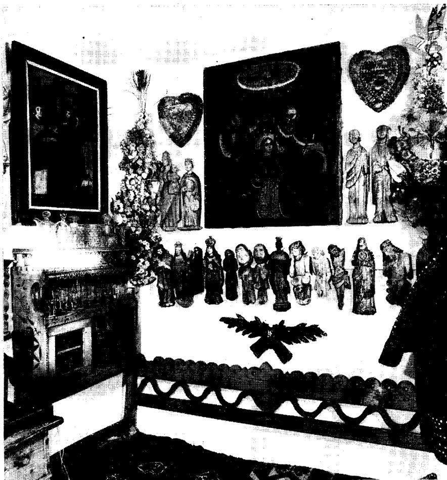
Il. 2. Fragment mieszkania. Il. 3. Matka Boska , rzeźba w drewnie, wys. 26 cm. Zabrzeż, pow. N. Sącz.

Tłumaczą to zresztą słowa gospodarza: „W sztuce ludowej jest prawdziwy prymitywizm nieświadomy, a ja podchwytuję te deformacje, anomalie, aby je zupełnie już świadomie rozwinąć, uzewnętrznić”.