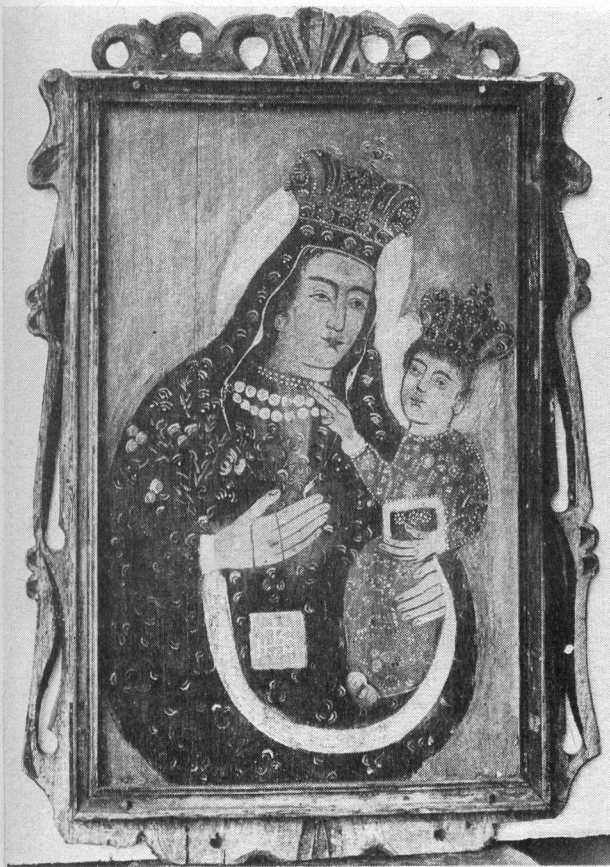
Il. 4. Chrystus Ukrzyżowany , rzeźba w drewnie, wys. 49 cm, z pow. Miechów. Il. 5, 6. Matka Boska z Dzieciątkiem . Obrazy olejne na desce.