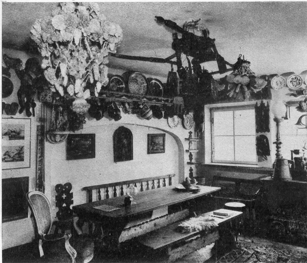
II. 1. Fragment mieszkania Zbigniewa Kowalewskiego.

Świątki te w porównaniu z oryginalną, dawną rzeźbą ludową — są bardziej kolorowe, w ekspozycji twarzy przerysowane, czasem aż do granic groteski. (Są w kolorystyce, w ekspresji twarzy bliższe współczesnej rzeźbie ludowej).