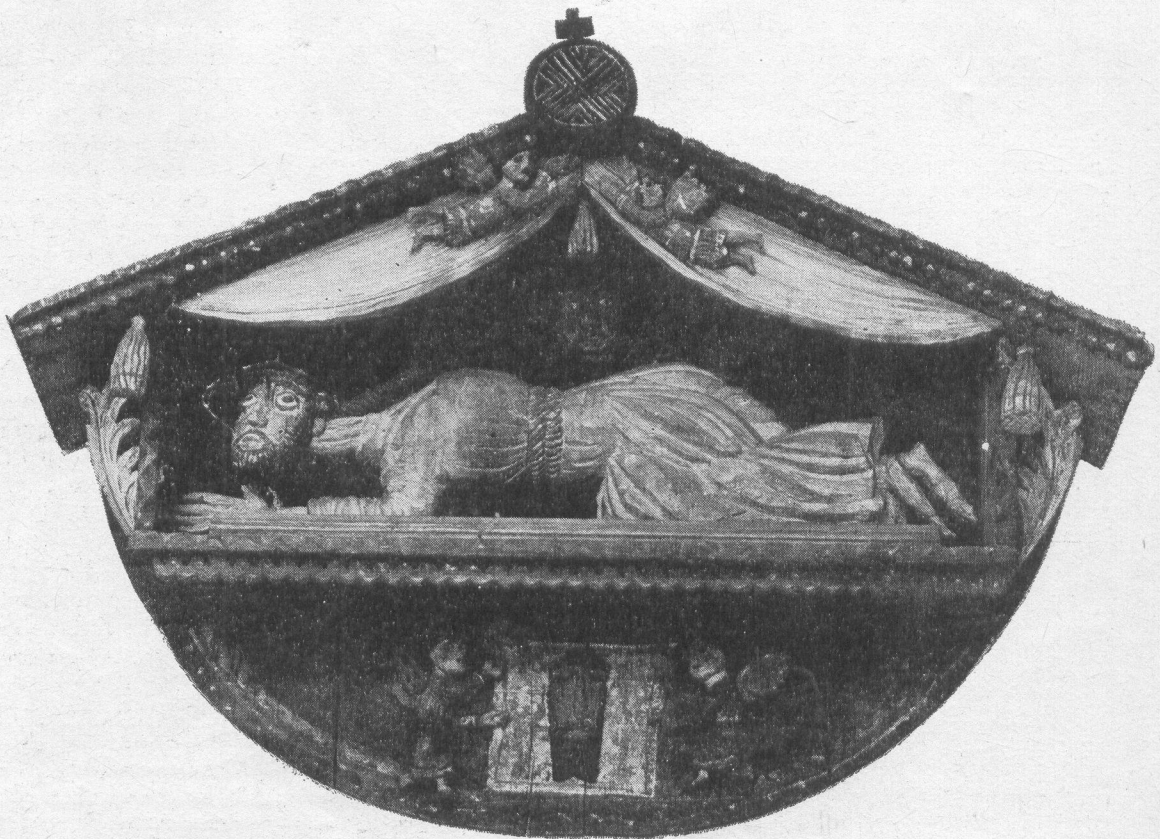
Zbigniew Kowalewski. II. 7. Pejzaż , olej na płótnie. II. 8. Kapliczka z Panem Jezusem pod Krzyżem, drewno polichrom.