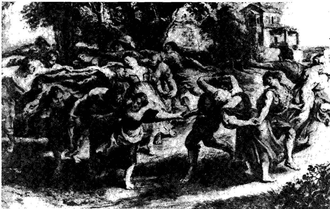
Il. 4. Peter Paul Rubens, Bautanz, repr. za Die Galerien Europas , München 1922

Wędrowka dziewcząt po zaświatach nasuwa nam jeszcze jedno skojarzenie. Kilka opisów obchodów nocy świętojańskiej zawiera informacje o obecności przy sobótkowym stosie kota lub psa. 25 Czarnego kota przynoszono w worku do ogniska, po czym z okrzykiem „dusa leci, dusa leci” przepędzano go w ciemność.