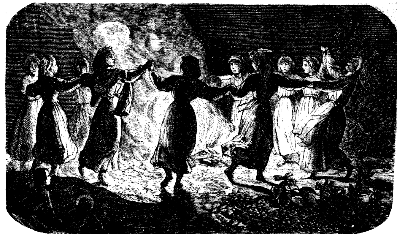
II. 2. Sobótko z Bilczy repr. za Dwok, Sandomierskie, t. 2

J.R. Tomiecy analizując słowiańskie mity kosmogoniczne doszli do stwierdzenia, iż „wszystkie, nawet najuboższe wersje mitu, kończące się w momencie utworzenia ładu, przekazują