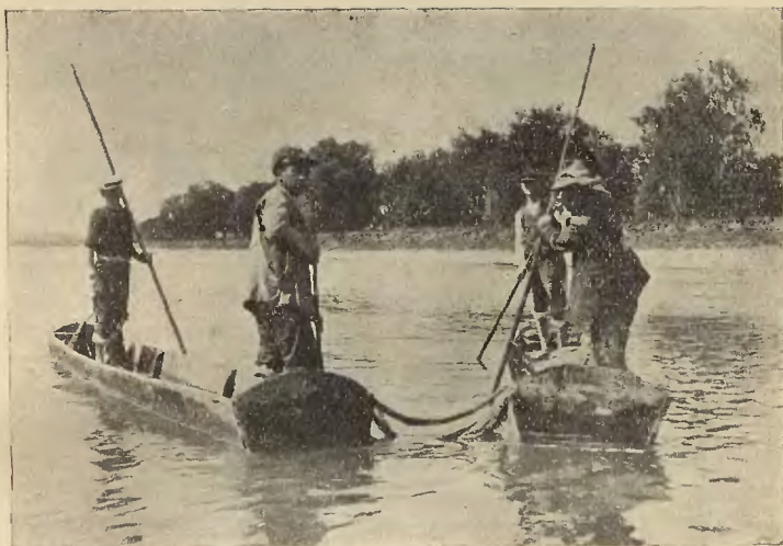
Ryc. 3. Łodzie rybackie.

Dolna część otworu sieci obciążona jest szeregiem symetrycznie rozłożonych, ołowianych ciężarków w kształcie grubościennych, krótkich rurek, aby zawsze opadała w dół (ryc. 4). Tak tę sieć, jak też i inne, poniżej opisane, wykonują w całości na miejscu rybacy z mocnego sznura konopnego własnego wyrobu. Przędza konopna jest jednak przeważnie kupna, gdyż tutejsi rybacy, posiadając za mało pola, nie mogą siać tyle konopi, aby na ich potrzeby wystarczało. Do wyrobu, jak też naprawy sieci, służy „wałek-wałok“ i „iglica-ihlycia“. (Ryc. 6). Tak iglica, jak i wałek są różnej wielkości i grubości, zależnie od tego, do której sieci mają służyć. Widziałem tu 3 takie komplety. Największy był dla sieci pojazdowej: iglica około 30 cm długości, wałek około 1 cm grubości. Do wyrobu innych sieci iglica i wałek są odpowiednio mniej-