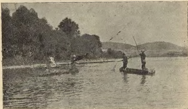
Ryc. 2. Połów „siecią pojazdową“ na łódkach.

z polecenia i dla tego Towarzystwa. W razie zapotrzebowania ryb, wysła Towarzystwo swego przedstawiciela (strażnika), który cały czas, idąc brzegiem rzeki, towarzyszy rybakom. Na punkcie końcowym odbiera on od rybaków cały połów, płacąc wedle umowy od kilograma ryb. Obecna cena (sierpień 1932) płacona przez Towarzystwo rybakom zasławskim wynosi 40 groszy od kilograma bez względu na gatunki ryb. Czasem, gdy złowione ryby są większe i należą do lepszych gatunków, cena jest nieco lepsza. Również w zimie cena jest zawsze wyższa. Na własną rękę i bez kontroli wyjeżdżają tutejsi rybacy tylko wyjątkowo, gdy są specjalnie dobre warunki połowu. Złowioną rybę przechowują oni wówczas „na zapas“ w specjalnej skrzyni, zbitej z desek, o wymiarach około 120 \times 120 cm, wysokości 1 m, zaopatrzonej w szereg małych otworów, którą zatapiają w Sanie przy brzegu.