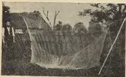
Ryc. 4. Sieć do bródki „bieguniec“.

Drugim sposobem połowu ryb, stosowanym przy małej wodzie jest t. zw. bródka, t. j. połów w górę rzeki pod prąd, bez łodzi. Rybacy udają się wówczas piechotą w dół rzeki pod Sanok i dopiero stamtąd, brodząc w wodzie boso lub w jakimś starym obuwiu, wyjątkowo w kupnych chodakach góralskich, wracając do domu, łowią ryby. Do bródki używają sieci zwanej „bieguniec-bihunec“ (ryc. 4). Jest ona kształtem zupełnie taka sama, jak sieć pojazdowa, różni się od tamtej mniejszymi wymiarami i mniejszymi oczkami, przytem drażki do trzymania i zatapiania sieci są odpowiednio mniejsze. Sieć taką trzyma, podobnie jak