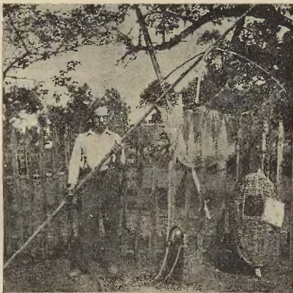
Ryc. 5. Sieć do podrywki „przygartaczka“, kosz na ryby zwykły i „sadzka“.

Innych sposobów połowu ryb rybacy zasławscy na Sanie nie stosują; nie zastawiają oni np. na głębiach węcierzy. Czynią to jednak rybacy z Trepczy, których rejon, mając znacznie więcej głębin, ma znacznie większy rybo- stan, należący do większych i lepszych gatunków. Łowienie ryb odbywa się przez cały rok, o ile tylko warunki atmosferyczne na to pozwalają. Jedynie w czasie tarła świnki, która stanowi gros łowionych tu ryb, t. j. w czasie od 1 kwietnia do 15