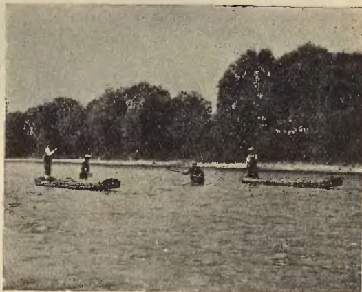
Ryc. 1. Połów na „bródkę“ podczas powrotu łodziami.

Ziemia Sanocka, nie posiadając żadnych jezior, ani też większych rzek, prócz na ogół dość płytkiego Sanu, nie wytworzyła specjalnych typów rybaków, znanych z innych, bogatych w wody połaci kraju. Niemniej jednak w kilku miejscowościach położonych nad samym Sanem, jak Mrzygłód, Trepcza, Zasław, Postołów i t. p. jest zawsze kilku mieszkańców, zajmujących się rybołówstwem, z którego się wprawdzie wyłącznie nie utrzymują, ale jest ono ich ważnym źródłem zarobkowym. Spędzając od kilkunastu lat wszystkie wolne chwile w jednej z tych miejscowości, w Zasławiu, miałem możność niejednokrotnie obserwować tutejszych rybaków i poznać ich sposoby połowu ryb oraz ich sprzęt rybacki.