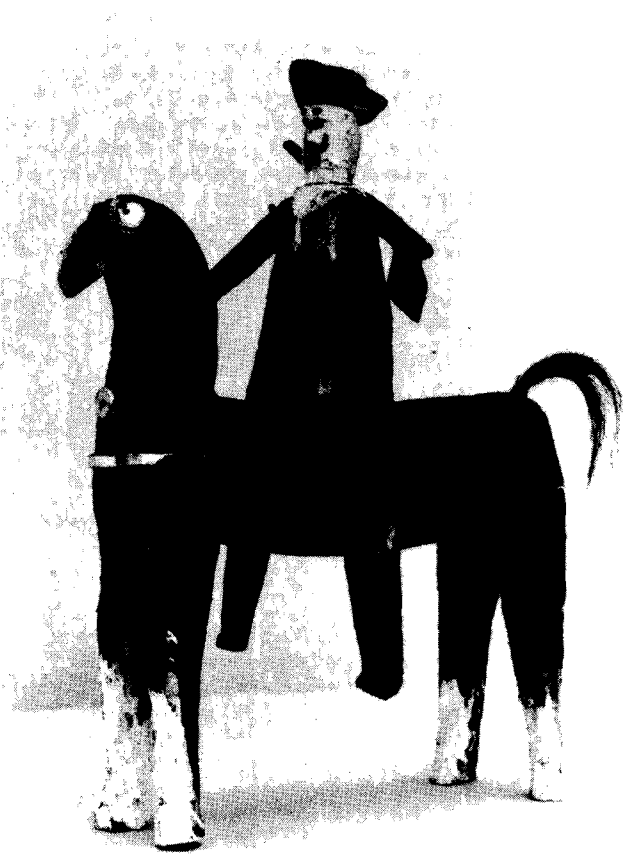
Il. 12. Helena Szczypawka-Ptaszyńska, Jeździec , drewno malowane