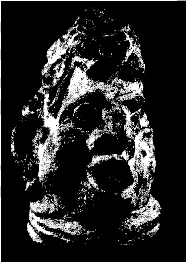
Il. 5. E. Monsiel, rysunek, wys. 17 cm; il. 6. E. Monsiel, rysunek w notatniku, wys. 18 cm (wczesny okres twórczości); il. 7. Eugeniusz Sutor, Głowa , kamień, wys. 23 cm, il. 8. Szczepan Mucha, Oskar Kolberg, drewno malowane, wys. 49 cm