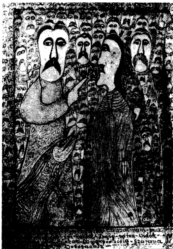
il. 1. Edmund Monsiel, „To jest Bóg...” rys./papier, 16,6 × 11,9 cm, 1957 r.; il. 2. E. Monsiel, Słowa Boga Ojca , rys. (papier, 15,7 × 9,8 cm, 1955 r.; il. 3. Heródek, Matka Boska , drewno malowane, wys. 70 cm; il. 4. Maria Wnęk, Autoportret , akwarela, 42 × 29 cm