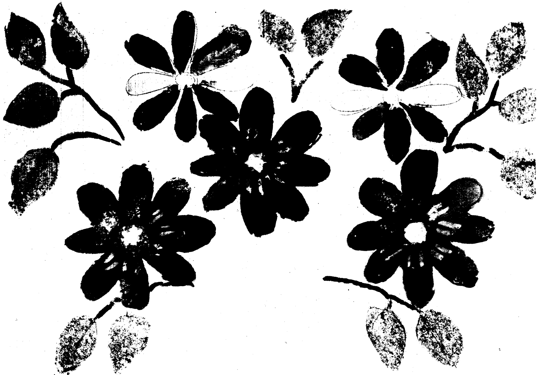
Tablica III. Malowanka ścienna. Malowała Janina Kominek. Chotyzie (pow. starachowicki).