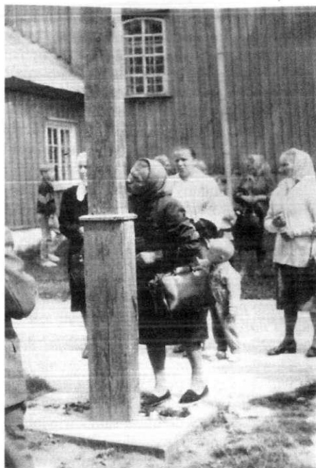
Po wyjściu z kościoła

Czy zatem pogranicze etniczne? Tego terminu zdecydowaliś-