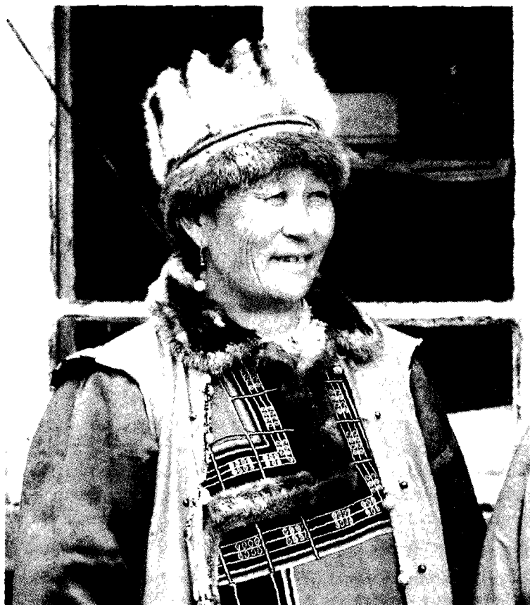
Ryc. 1. Letnie tradycyjne stroje Telengitów można zobaczyć już tylko podczas świąt. Zimowa szuba i czapka z lisich łapek są noszone w dni powszednie. Rejon Kosz Agacz, wieś Kokoria