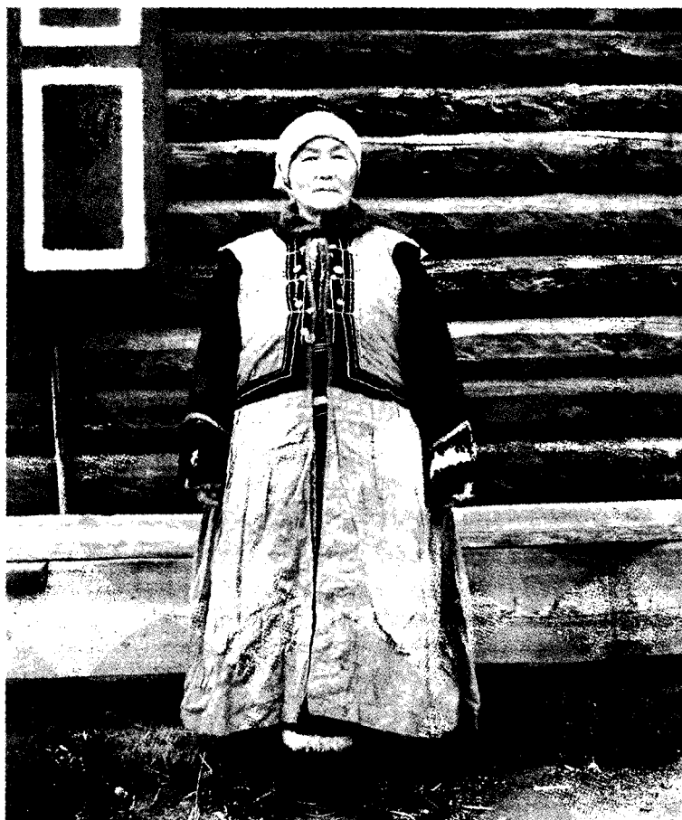
Ryc. 3. Kobieta w tradycyjnym stroju zimowym Telengitów. Rejon Kosz Agacz, wieś Belyr.