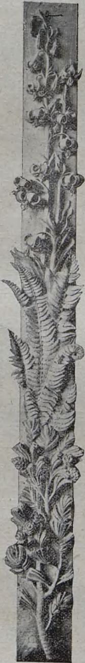
Rzeźba z ołtarza M. B. Różańcowej w kościele Zakopiańskim.

Istnieją już również próby zastosowania stylu zakopiańskiego do budowli muryowanych, bo w zasadzie nic temu nie stoi na przeszkodzie, jak tylko już są » pewne stałe formy i prawa, pewne stosunki wymiarów i kształtów, pewne warunki wiązania i szczególne pierwiastki w zdobieniu«. Chodzi tylko o zmianę materiału, a w cechach stylu zakopiańskiego nie ma przeszkód do zastąpienia drzewa kamieniem. Przeciwnie nawet otoki półokrągłych drzwi wprost się proszą o przeniesienie w kamień. Próby