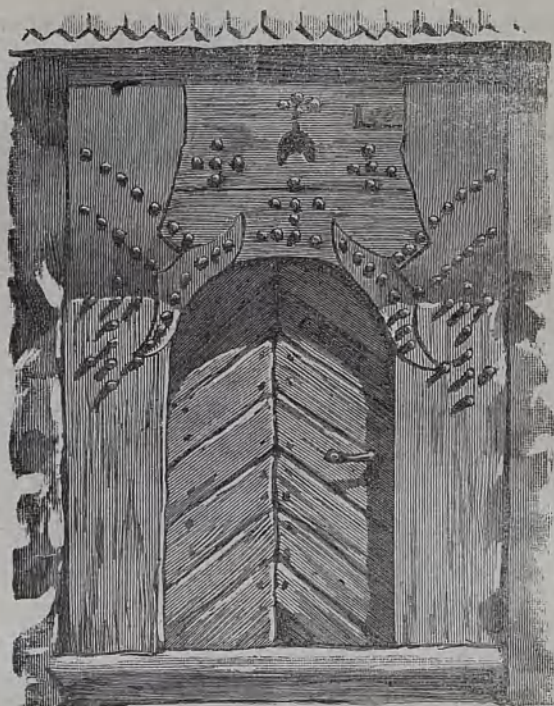
Drzwi chaty góralskiej.