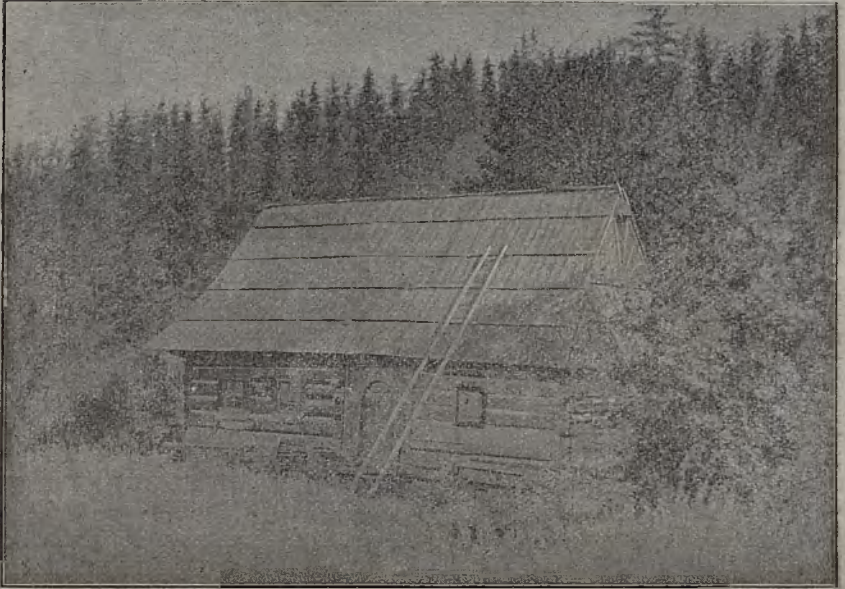
Młynek Stopki w Zakopanem. Z dzieła Matlakowskiego.

Dzieło Matlakowskiego przytem ma wielką zaletę, jest praktyczne, a wartości jego dowiedli sami cieśle góralscy, budarze, którzy go się nieraz radzą i przy budowie używają.