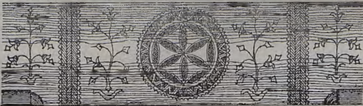
Sosrąb w starej chacie góralskiej przerysowany przez Matlakowskiego.

To co było, uratował Matlakowski. Stara chata z charakterystycznym układem belek, sosrąbem, tak oryginalnymi odrzwiami — z mnóstwem sobie właściwych a tak odrębnych szczegółów znalazła w Matlakowskim gorącego, przejętego zapałem mono-