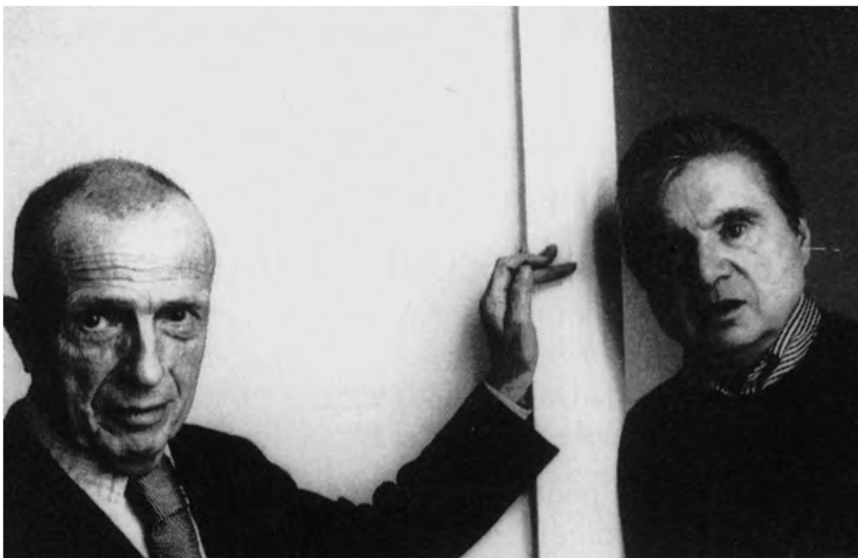
Francis Bacon i Michel Leiris, 1970.