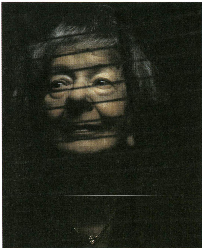
Wisława Szymborska

fotografii. Oto widzimy, że podczas sesji zdjęciowej kompozytor (pokazuje to obraz filmowy) ubrany jest we wspaniały (ze śnieżnobiałą muszką) strój dyrygencki tylko do połowy, (w spodniach już „codziennych”, „nie z tej parafii”). Nawet jeśli autor portretu nie podda go przetworzeniu w komputerze, co czyni ostatnio, nie doda, nie zmieni barw, zachowa go w klasycznej czarno-białej postaci, widz na wystawie, czy oglądając zdjęcie w albumie, nic o tym, o tej niekompletności stroju nie będzie wiedział. Oto przyczynek do prawdy fotografii. A co zostanie z prawdy Noblistki fotografowanej z klatką z papużkami? Czy zachowa się czysta poezja, jaka wynika z rozmowy podczas zdjęć?