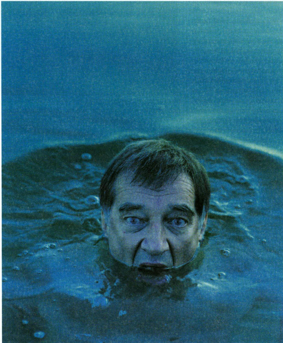
Krzysztof Gierałtowski.

Dlatego też z wdzięcznością skorzystałem, z myślą też i o przyszłych czytelnikach z możliwości rozmowy z autorem, który zechciał oprowadzić mnie po swojej wystawie, której to rozmowy zapis publikujemy poniżej.