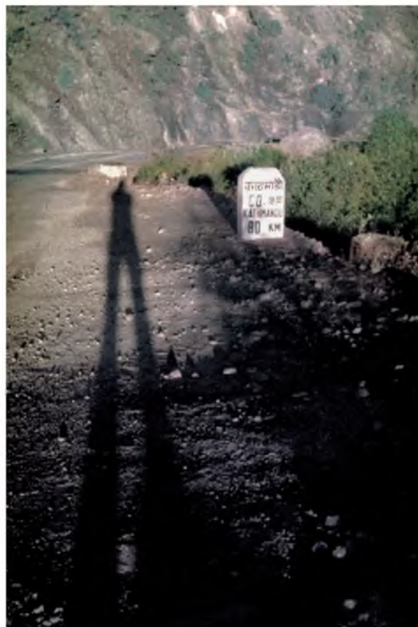
2. Nepal. O wschodzie słońca - mój cień na przełęczy Daman, już tylko 80 km do Katmandu.

Dzisiaj cuda techniki XXI wieku – skaner i komputer – pozwoliły mi odzyskać utracone obrazy z podróży! Wróciły, kolory a wraz z nimi wróciły wspomnienia! Patrząc na zdjęcia, przymykam oczy i powoli pod powiekami przesuwają mi się inne widoki, przypominają mi się smaki i kolory, zapachy i dźwięki. Wracają cudowne chwile, kiedy czas jakby zatrzymał się w miejscu, a przestrzeń odsłaniała coraz to nowe, ogromne krajobrazy. W nocy niebo otwierało się nade mną całkiem nowymi konstelacjami i było oczywiste, że jestem w innym świecie. Że jest inny świat. Świat, gdzie ludzie „chodzą do góry nogami”, są inni i żyją zupełnie inaczej.