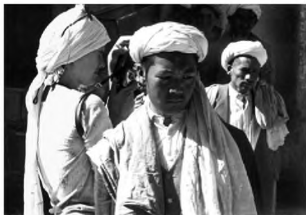
1. Afganistan. Gdzieś w środku kraju. Bezwiednie zatapiając się w otoczenie i fotografuję.

Dziennik prowadziłam przez całą podróż. W stuartkowym zeszytce oklejonym kawałkami brązowego zamszu. Na okładce naklejona rękawiczka. Ma tylko cztery palce, ale przypomina bardzo rączkę Fatimy. Notatki drobnym maczkiem. Dzień po dniu. Dziś czasami trudno mi je odrozczytać. Notowałam wszystko. Jak przebiegał każdy kolejny dzień, co na śniadanie, co