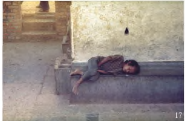
14-15. Indie. Przy drodze do Patny. Życie toczy się tu na ulicy, czy to w dzień, czy w nocy 16. Indie. Delhi. Takie obrazki zauważam, ale mnie one nie szokują. Czy dlatego, że jestem młoda i głupia? 17. Nepal. Katmandu. Dużo dzieci tu pracuje. Są zmęczone i śpią na ulicy 18. Indie. Delhi. Jeden z Sikhów, których spotkałam zwiedzając Red Fort. Trochę dzikie spojrzenie! 19. Indie. Kajuraho. Ta dziewczynka wyszła do nas jakby prosto z „Księgi dżungli”