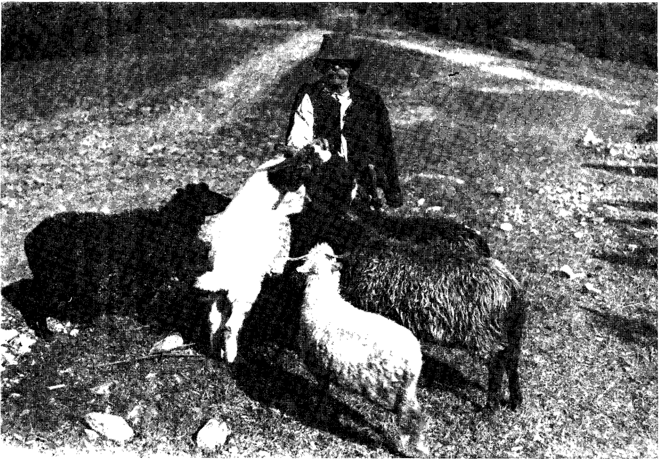
Il. 7. Najduch, stary pasterz z Rychwałdu, 1929 r.

dynie Pismem św. Wziąłem Stary Testament i przetrzymałem go, o ile pamiętam, z tydzień. Ogromnie przez to awansowałem w oczach naszych gospodarzy, zaczęli na mnie spojierać jak na potencjalnego kandydata „na brata” tym bardziej, że niejednokrotnie zadawałem im pytania na temat ich wyznania.