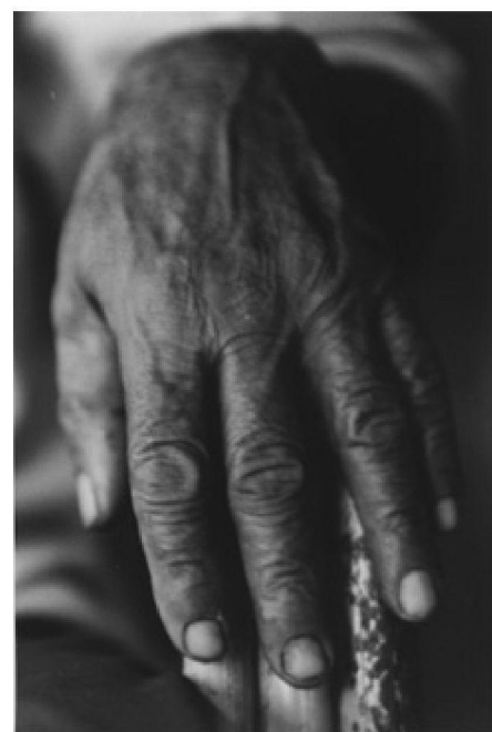
FOT. JEREMY MILLAR, MATERIAŁY PRASOWE MUZEUM SZTUKI W ŁODZI