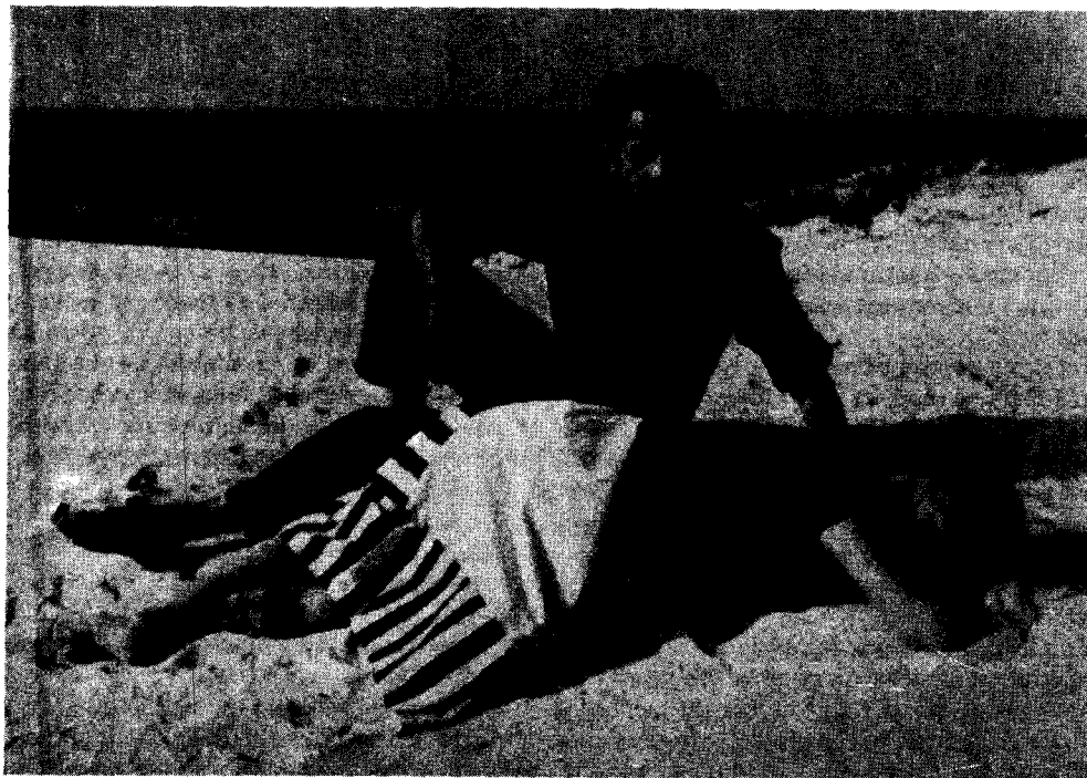
Kadr z filmu Tadeusza Konwickiego „Ostatni dzień lata”

Obraz filmowy nie jest obrazem statycznym, nie tylko przez fakt, że jest ruchomy, ale również przez to, że fragment sfilmowanej rzeczywistości tam zawarty poddany jest dynamizacji, w znaczący sposób nacechowany rytmem następujących po sobie ujęć. Prawdą jest, że rytm taki zgodny jest na ogół z następstwem logicznym znanym i rozumianym w codziennym doświadczeniu, ale ta nowo wykreowana rzeczywistość z rzeczywistością codzienną nie ma już nic wspólnego.