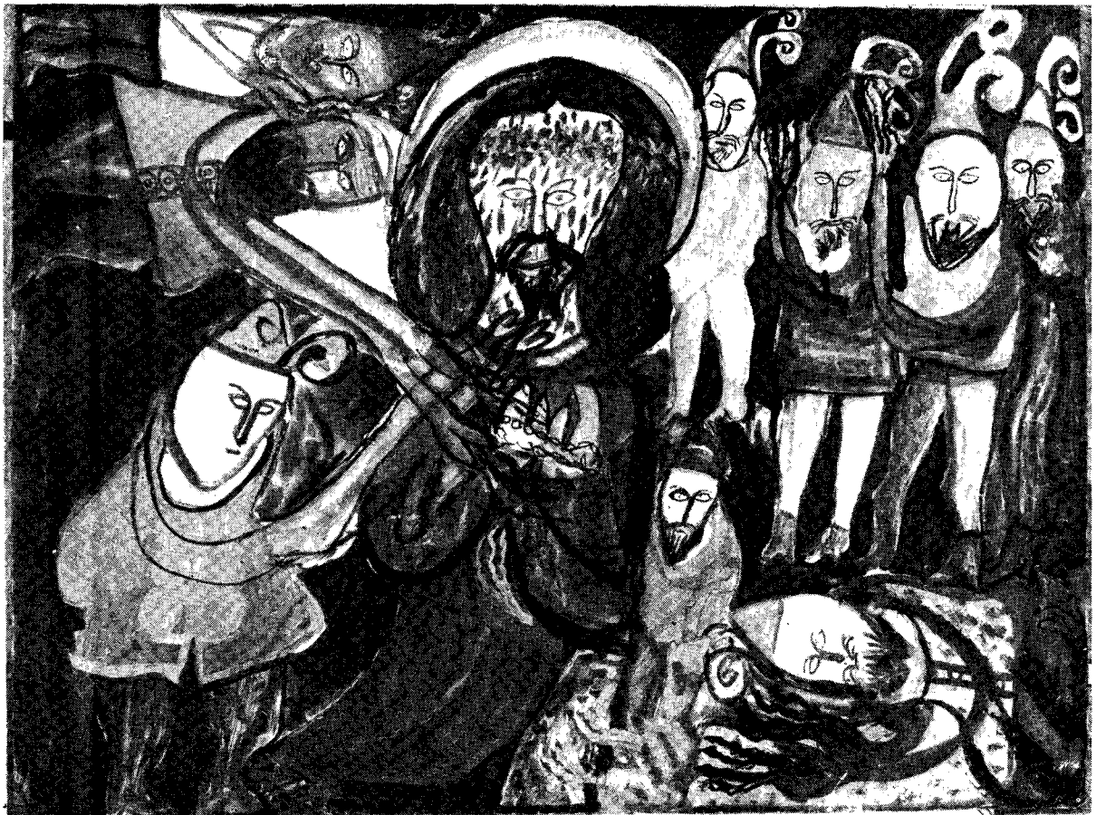
Il. 7. Wyrzucanie Marii Wnęk z mieszkania w Nowym Sączu, wym. 34 × 50,5 cm; il. 8. Męka Pańska: Pan Jezus osadzony na pniu w piwnicy, wym. 75,5 × 100 cm; Il. 9. Nagłqca wiadomość, wym. 49,5 × 69,5 cm