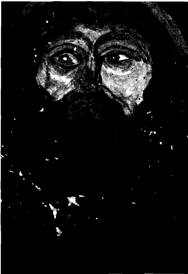
Il. 14. Przemienienie Pańskie , wym. 32 × 22 cm; Il. 15. Pożar domu w Olszance „Jak ja się palę” , wym. 50 × 75 cm