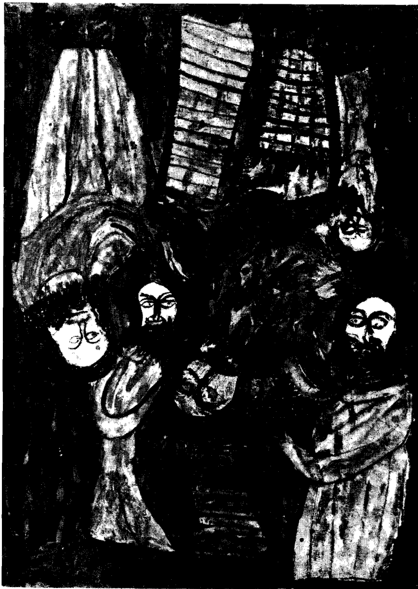
Il. 10. Do słupa przywiązany Pan Jezus w środku piwnicy stojący, wym. 70 × 49,5 cm, 1976 r.