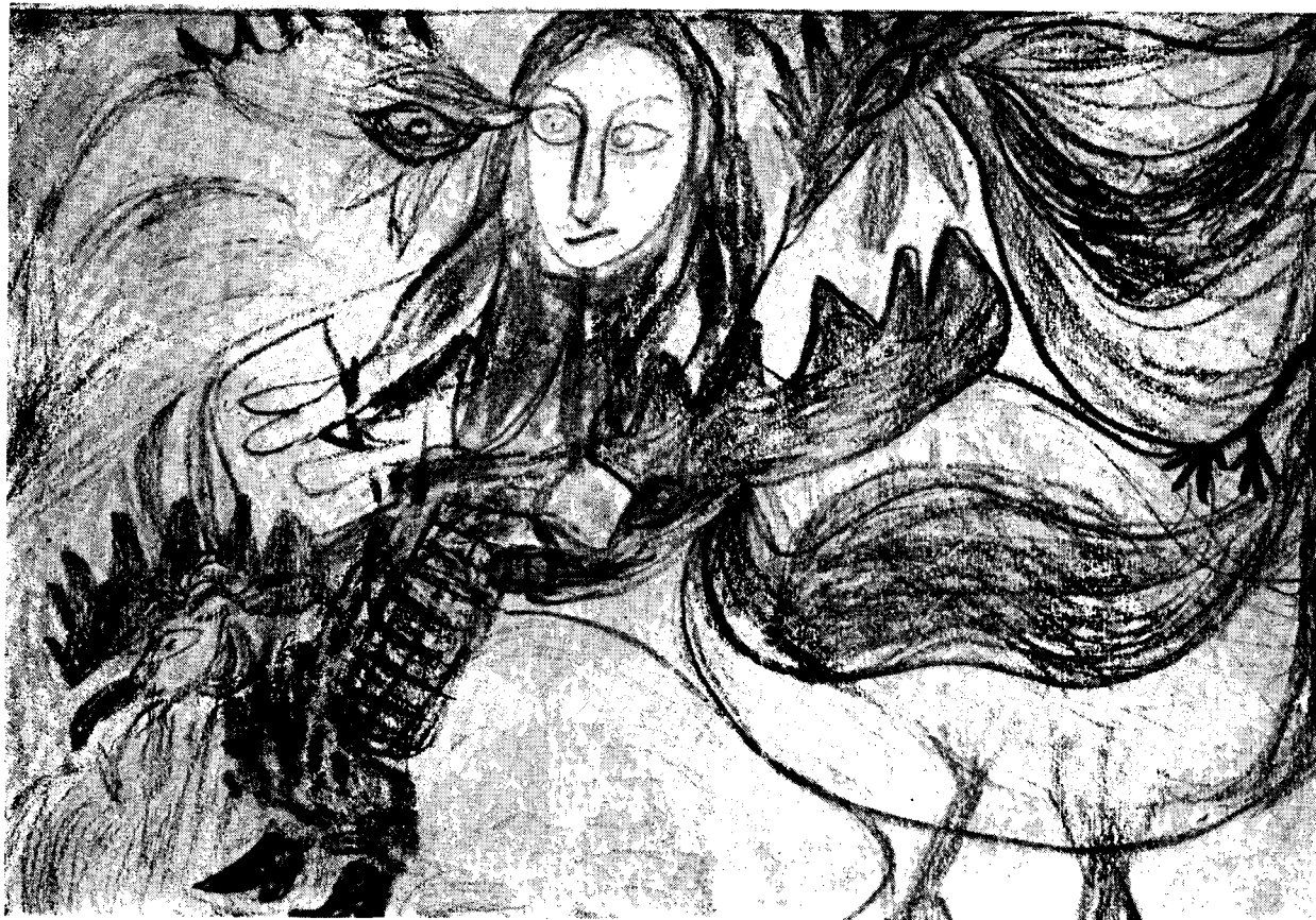
Il. 4. Modlitwa z kurami , wym. 23 × 32,5 cm

Chętnie zawsze sprzedawała swoje obrazy, bo stale brakowało jej pieniędzy, przy czym najczęściej nabywali je kolekcjonerzy. Oni też, pozostając z nią w nieprzerwanym kontakcie, byli zazwyczaj dostarczycielami niezbędnych materiałów do malowania (papieru, tektury, pilśni, sklejk, rzadziej płótna) i farb (temper, olejnych, lakierów itp.). Jeżeli odczuwała braki w tym zakresie wówczas listownie ich alarmowała, w międzyczasie malując na tym co własnym sumptem zdobyła (blacha, derma, siedzenia krzeseł i in.). Zazwyczaj w takich wypadkach odpowiadano na jej prośby (nierazko przywożąc farby zza granicy), a ona korzystając z tych materiałów często zaznaczała na obrazie dla kogo jest przeznaczony. Zdarzało się też, że z wdzięczności za pomoc i opiekę ofiarowywała określonej osobie swoją pracę: „Proszę przyjąć obraz jako prezent najdroższa pani Ewa Harsdorf od Marii Wnęk” lub na innym „Malarka ludowa słynna po całym świecie ofiaruję (L. Macakowi) jako podarunek na 6 grudnia na Mikołaja dla szanownego pana jako mały prezencik,