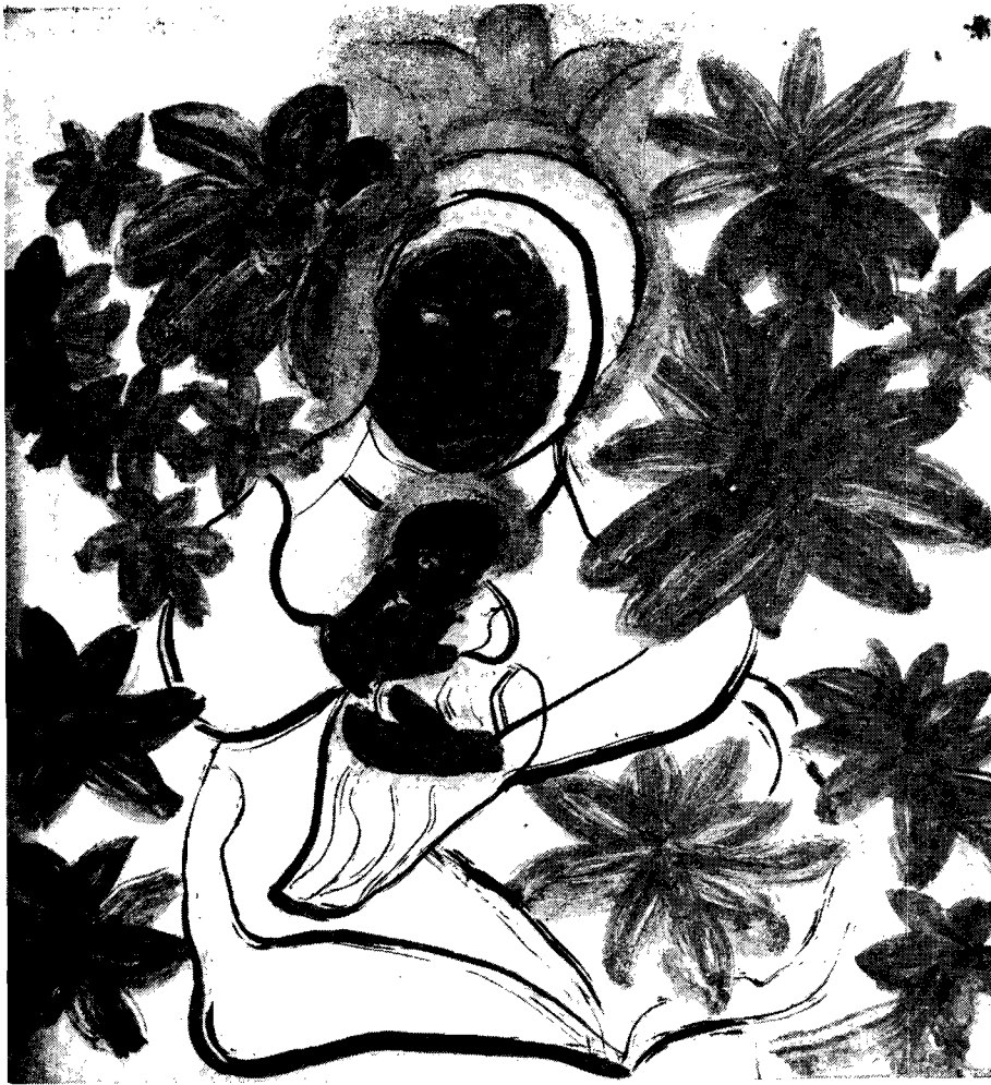
Il. 5. Pan Jezus z Apostołami idzie na Górę Tabor , wym. 70 × 100 cm; il. 6. Matka Boska Saletyńska bawi Dzieciątko , wym. 39,5 × 37 cm

Wszystkie „tragiczne przeżycia” z Olszanki, jak też krzywdy doznane w Nowym Sączu, stanowią zasadniczy motyw wielu obrazów, jakie namalowała w latach siedemdziesiątych. Trudno ocenić prawdziwość faktów przez malarkę podawanych, które wiele razy powtarzając, wzbogaca lub zuboża w szczegółach, przekazując je z różnym zabarwieniem emocjonalnym w zależności od aktualnego samopoczucia. W swoich opiniach i ocenach ludzi, z którymi los ją zetknął, jest najczęściej niezwykle krytyczna, surowa i wręcz obsesyjnie przypisująca większości złe intencje w stosunku do siebie. Przyczynę swoich nieszczęść widzi w zawiści, chciwości i mściwości ludzkiej. Wrogów znajduje zawsze w najbliższym otoczeniu.