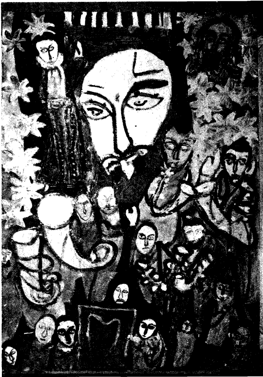
Il. 16. Pochód 1 Majowy z muzykantami , wym. 100 × 70 cm