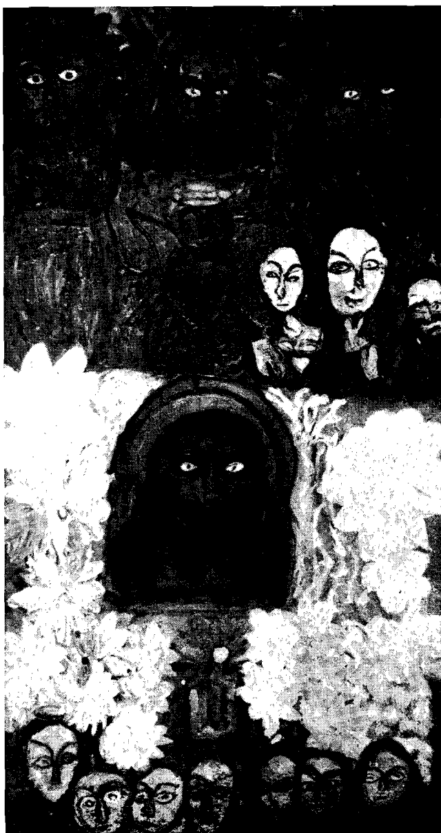
Il. 12. Przemienienie Pańskie , wym. 102 × 55 cm