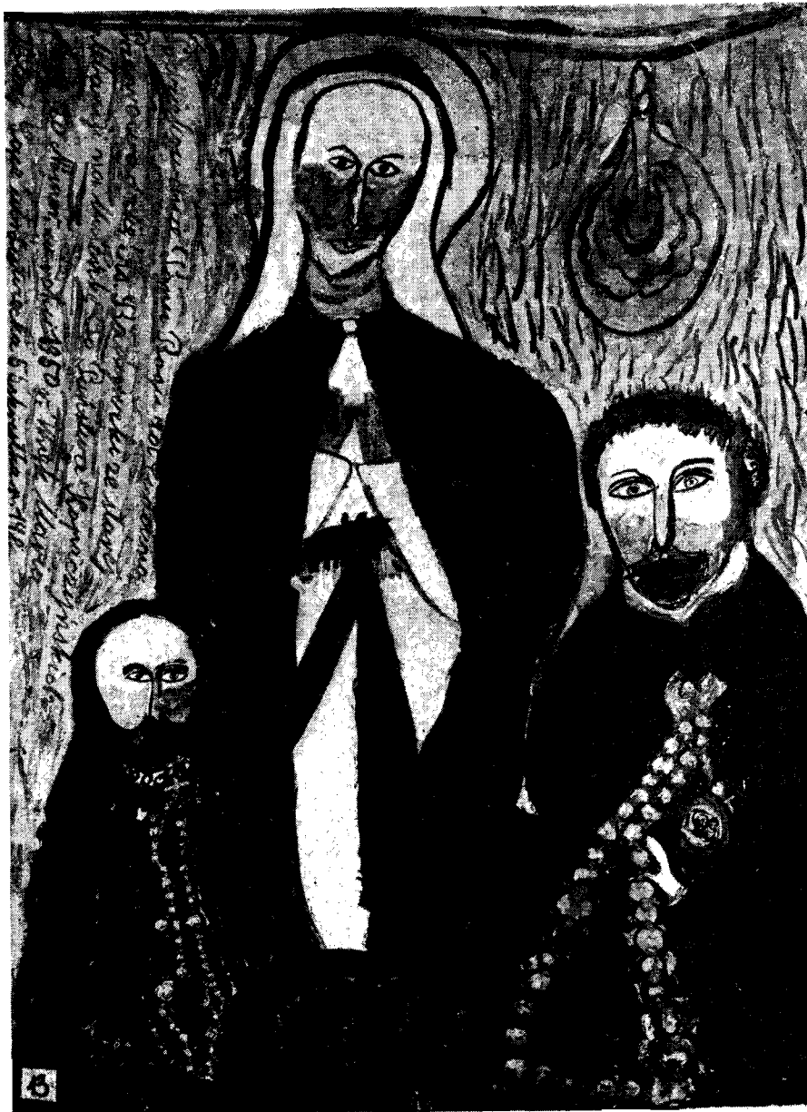
Il. 11. Podziękowanie Panu Bogu za cudowną przeprowadzkę księdza , wym. 41 × 29,5 cm, 1974 r.

na jednym obrazie kilku scen dokumentujących relacje malarki, bądź rozbudowane, pełne dynamiki i ekspresji sceny zbiorowe (np. Męka Pańska , manifestacje i pochody 1-Majowe).