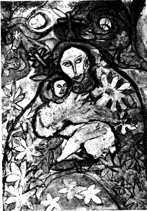
II. 3. Madonna z Dzieciątkiem i aniołkami , wym. 71 × 50 cm