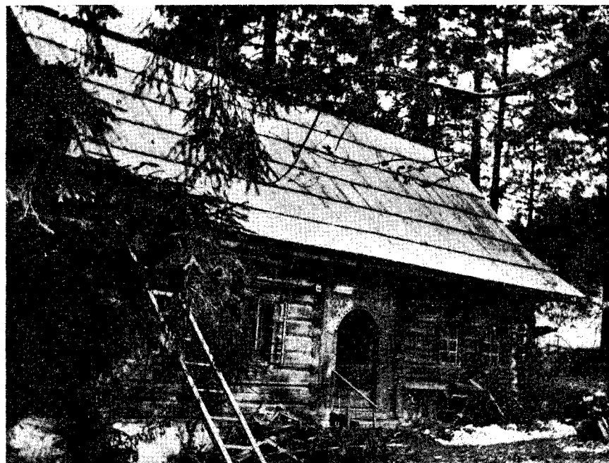
Ryc. 1. Oddział Muzeum Tatrzańskiego w domu „Tea“ w Zakopanem.

Tatrzańskiego posiada dwie sale wystawowe: jedną na parterze, w której mieszczą się zbiory etnograficzne, drugą na pierwszym piętrze, w której mieszczą się zbiory geologiczne i przyrodnicze. Powierzchnia obu sal wynosi 494 m 2 , kubatura 1875 m 3 . Na drugim piętrze mieści się magazyn zbiorów etnograficznych i pracownie. Na trzecim piętrze również mieszczą się pracownie. Nowy gmach nie posiadał specjalnego pomieszczenia na zbiory biblioteczne; księgozbiór ulokowano w kilku pokojach.