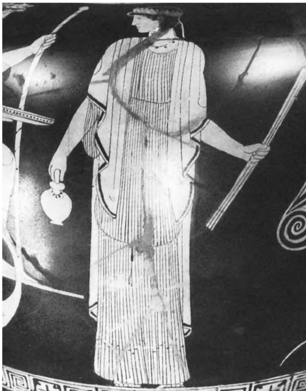
Persefona, Leyda, Rijkmuseum