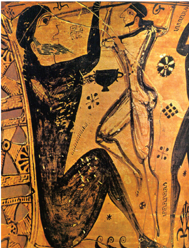
Malowidło z wazy odnalezionej na terenie Eleusis, przedstawiające oślepienie Polifema przez Odysseusza. VII w. p. n. e., Muzeum w Eleusis, źródło: www.holycross.edu