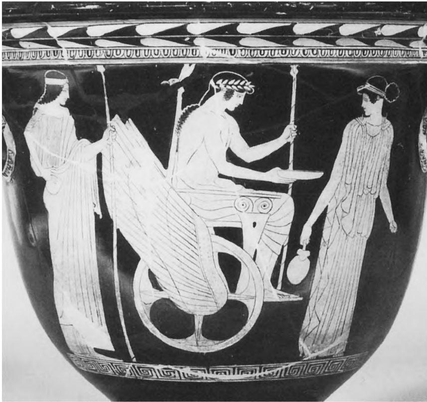
Persefona, Londyn, British Museum