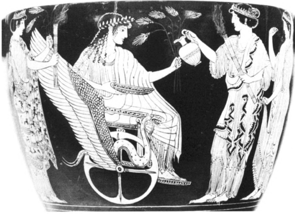
Demeter, Londyn, British Museum; Źródło: Lexicon Iconographicum Mythologiae Classicae , Artemis Verlag, Zurich