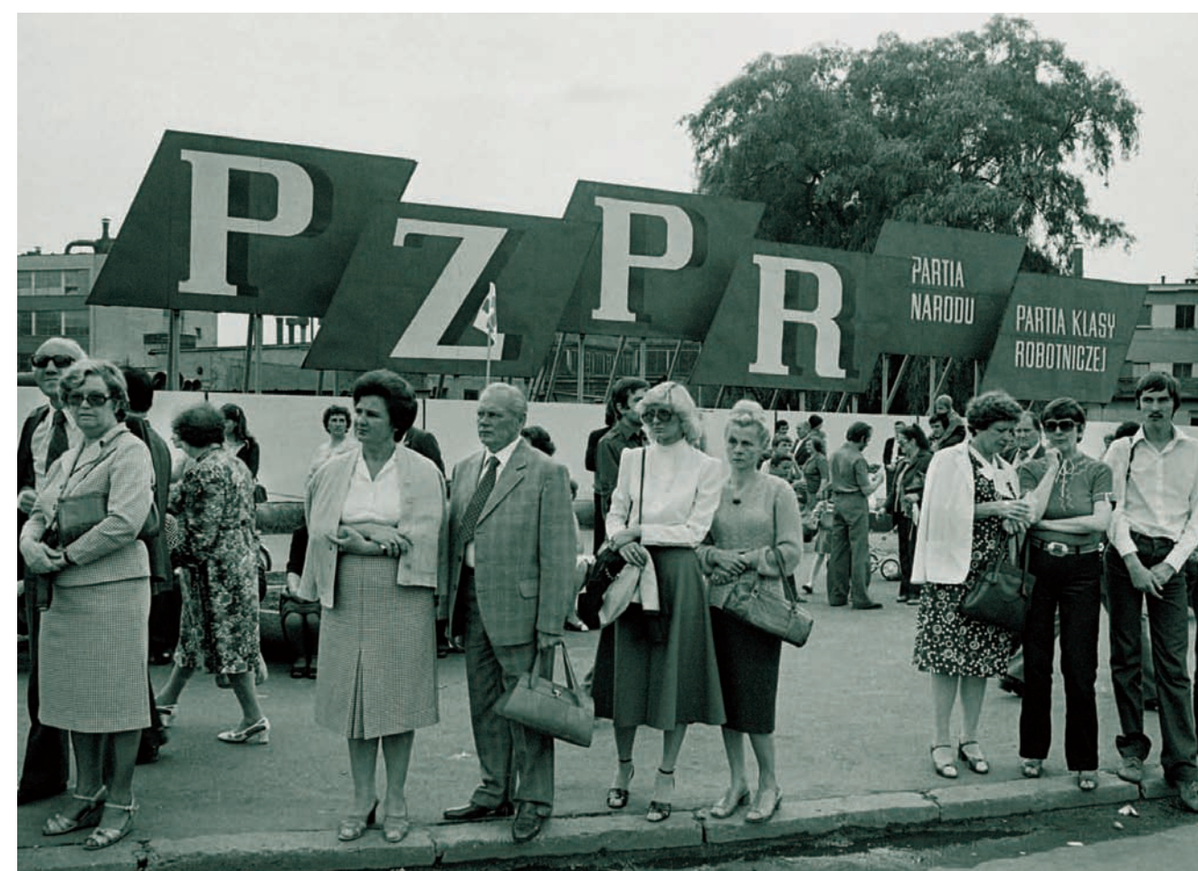
Fot. Anna Beata Bohdziewicz

Okladka: pierwsza strona: Fot. Anna Beata Bohdziewicz . czwarta strona: Fot. Fot. Anna Beata Bohdziewicz.