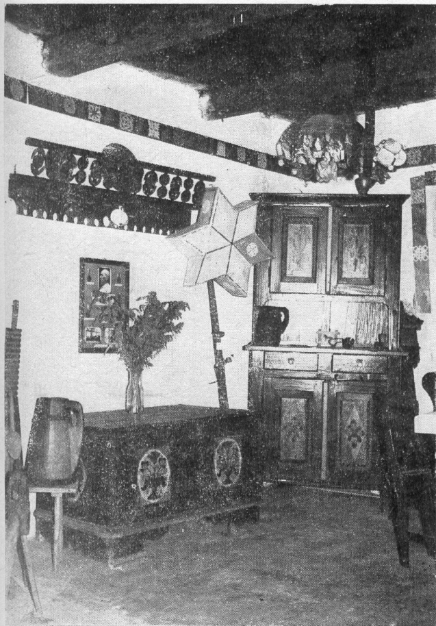
Il. 4. Wnętrze izby regionalnej. Il. 5. Zegar rzeźbiony, Czerniec, pow. N. Sącz.

W zbiorze znajduje się sporo eksponatów cennych i interesujących, jak np. oryginalnie zdobione „kratki”, czyli półki na naczynia, czy ryzowana skrzynia sarkofagowa. Dalej — kilka starych rzeźb drewnianych, piękna, płasko-