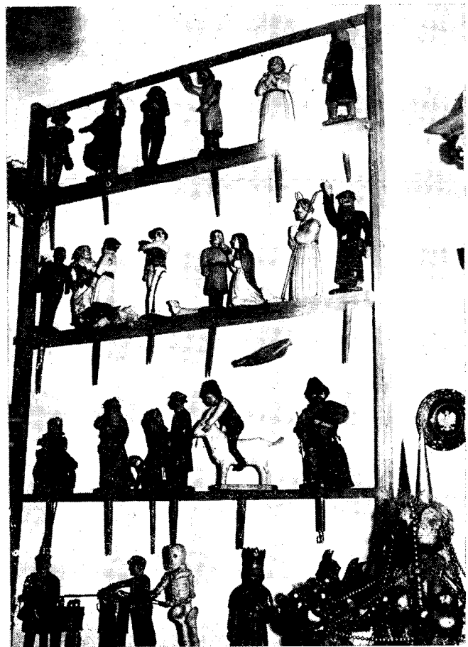
Il. 7. Pietà, płaskorzeźba w drewnie, polichromowana, Podegrodzie. Il. 8. Lalki do szopki, wyk. Leon Potoniec, Olszana.

W przeważającej większości wypowiedzi daje się zaobserwować w mniejszym lub większym stopniu poczucie dumy z faktu, że „w Podegrodziu jest muzeum”.