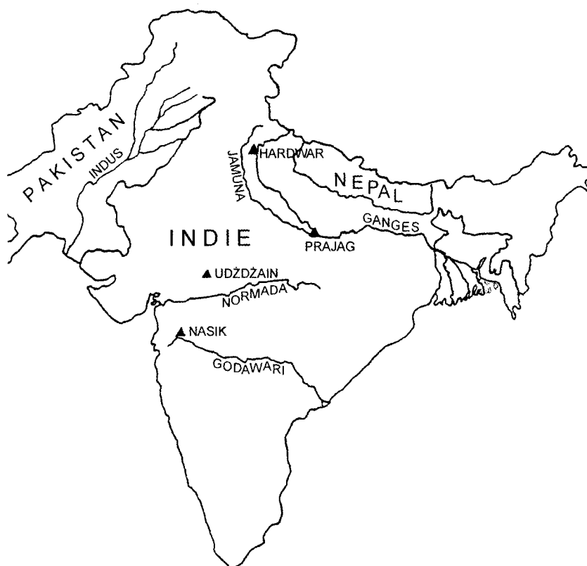
Rys. Anna Demska