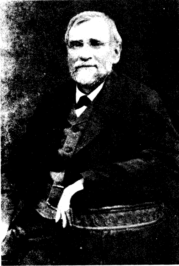
Oskar Kolberg (1814–1890)