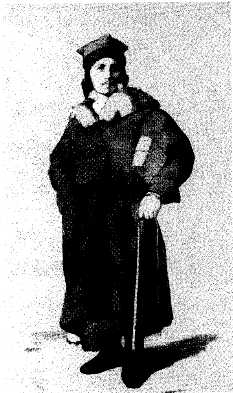
Od Piaseczna (Obory)