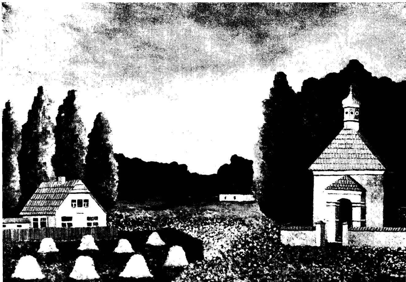
4 Il. 4. Julian Bajkiewicz, Pejzaż z okolic Chelma , ol./pl., 46,5 × 66,5 cm. Il. 5. Honorata Góra, Szatkowanie kapusty ol./pl., 69 × 100 cm.