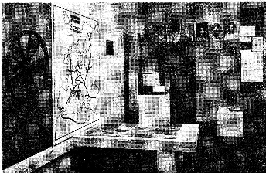
Wstępna część ekspozycji „Cyganie i ich kultura” w Muzeum Okręgowym w Tarnowie.

cygańskiego oraz materiały mówiące o roli, jaką w kulturze polskiej zajmowali i zajmują Cyganie.