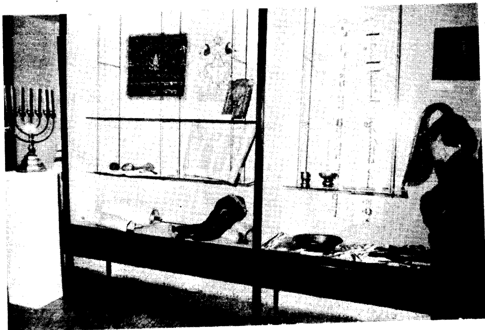
Fot. 3. Fragment wystawy