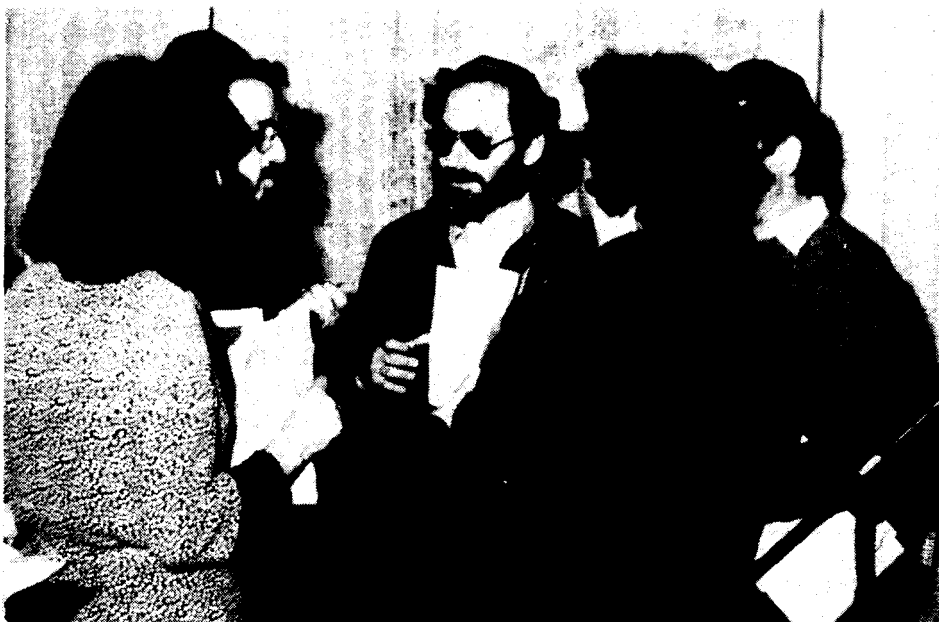
Fot. 5. Podczas przerwy w obradach