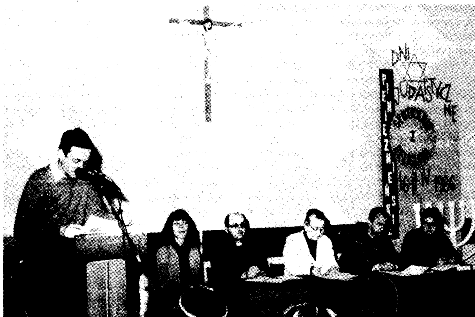
Fot. I. W czasie obrad