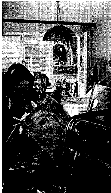
fot. 6. Mieszkanie w Opolu po zejściu wody, fot. Przemysław Nijakowski.

A zatem osvajanie zdegradowanej przestrzeni, poszukiwanie w niej punktów orientacyjnych, gwarantujących człowiekowi poczucie bezpieczeństwa, ma również istotne kulturowe odniesienia, tworząc wyraźny łańcuch zależności: nasz świat — znany, oswojony, piękny, bezpieczny oraz świat na zewnątrz — nieznan, dziki, brzydki, niebezpieczny.