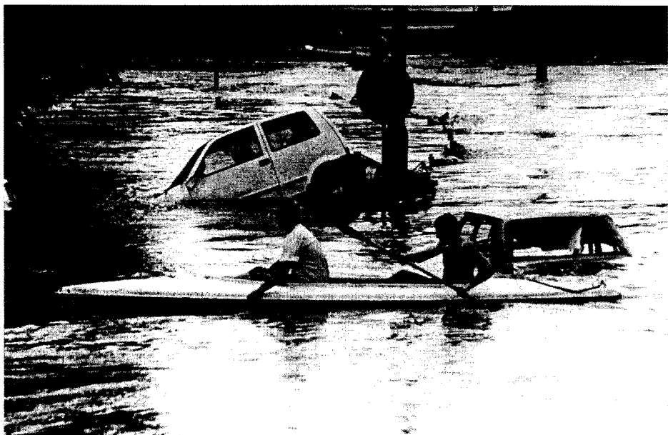
fot. 2. Powódź w Opolu.