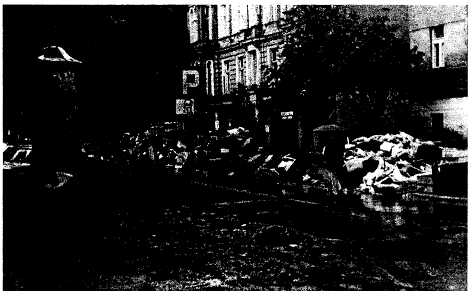
fot. 3. Ulice Opolu po zejściu wody, fot. Przemysław Nijakowski.