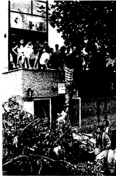
fot. 1. Zaodrze (dzielnica Opola), fot. Przemysław Nijakowski.

Miejsce dotychczasowego życia naznaczone zostało piętnem klęski , kojarzyło się tylko z negatywnym doświadczeniem. Świadomość istniejącego lub wyobrażonego zagrożenia zburzyła poczucie bezpieczeństwa. Trudno zatem było ludziom zaakceptować „tę samą, a jednak nie tę samą” przestrzeń codziennego bytowania. Poczucie zagubienia i krzywdy nasilała świadomość utraty dorobku całego życia.