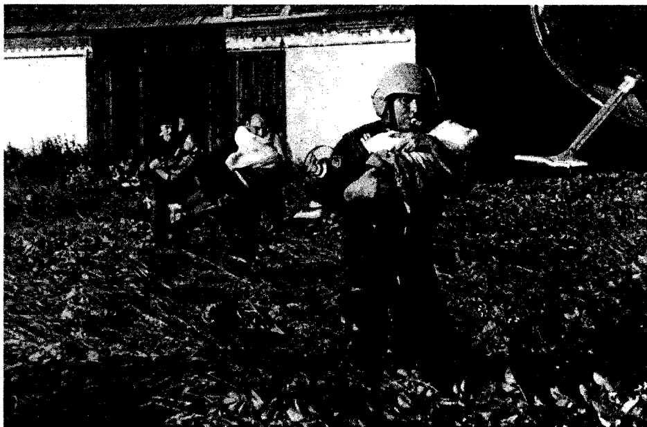
fot. 4. Ratownicy w akcji, fot. Przemysław Nijakowski.