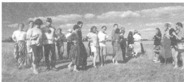
IV Międzynarodowe Sympozjum „Muzyka Ludowa Europy Środkowo-Wschodniej”. Rybaki n/Narwią, 1994. Tańce litewskie i huculskie (na s. 13)