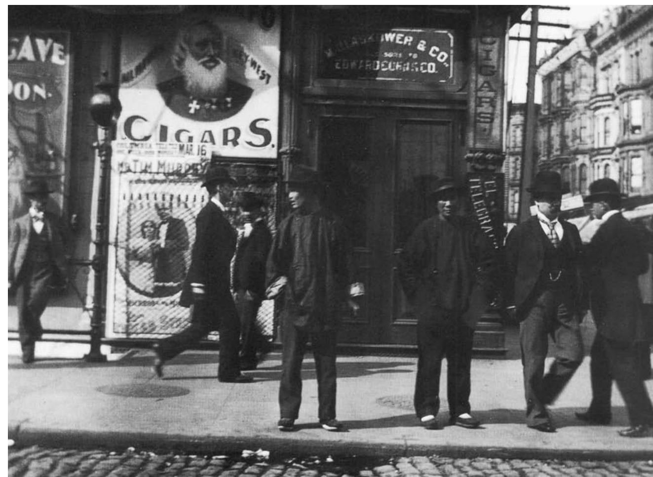
Fot. Aby Warburg. Chinatown, San Francisco, luty 1896. Za: Photographs at the Frontier. Aby Warburg in America 1895-96 , ed. B. Cestelli Guidi, N. Mann, Londyn 1998, s. 90