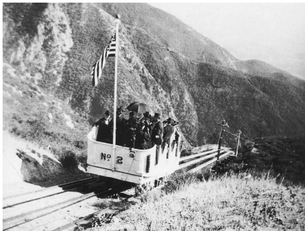
Fot. Aby Warburg. California, luty 1896. Za: Photographs at the Frontier. Aby Warburg in America 1895-96 , ed. B. Cestelli Guidi, N. Mann, Londyn 1998, s. 87

Okładka: Aby Warburg podczas burzy piaskowej, Arizona, kwiecień 1896. Za: Photographs at the Frontier. Aby Warburg in America 1895-96 , ed. B. Cestelli Guidi, N. Mann, Londyn 1998, s. 113