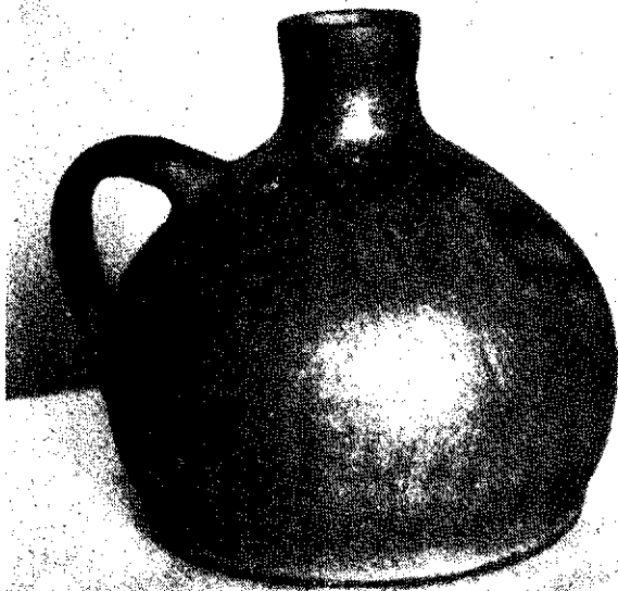
Ryc. 1. Butla siwa, dymiona. Wykonał Józef Kuźniar. Zalesie, pow. Łańcut.

Wystawa cieszyła się dużym powodzeniem i frekwencją, co dowodzi potrzeby urządzania imprez z tego zakresu. Szkoda tylko, że przeciążony pracą Wydział Kultury w Rzeszowie nie potrafił powiązać działalno-