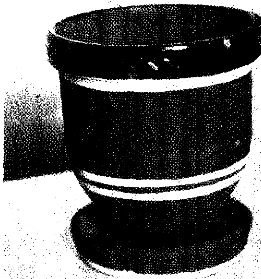
Ryc. 2. Doniczka osłaniająca, klelichowa, czerwona. Wykonał Andrzej Ruta, wieś Medynia Głogowska, pow. Łańcut.