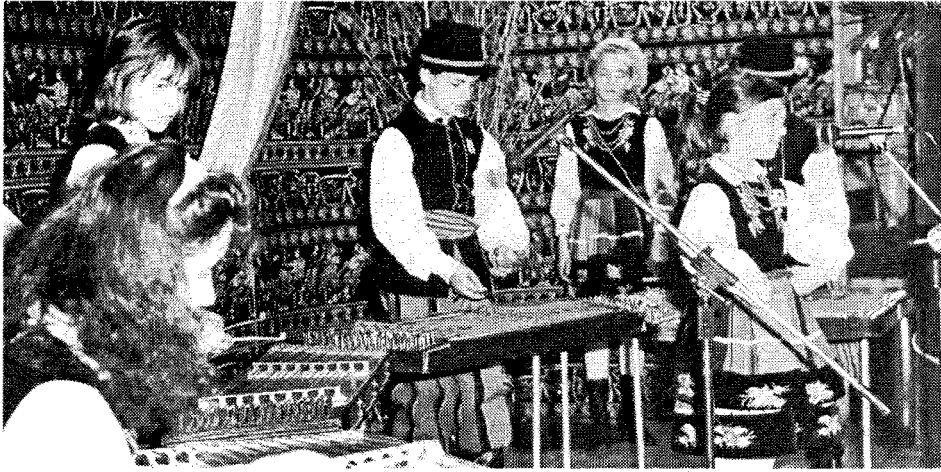
Fot. 1. Kapela z Mostów