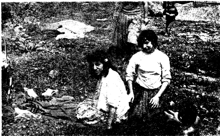
Ryc. 1. Młode Cyganki z Szaflar. Fot. A. Bartosz. 1975 Fig. 1. Young Gypsies, Szaflary. (Photo: A. Bartosz, 1975)

Cyganie osiedli we wsiach polskiego Spiszu, podobnie jak na terenie całych Karpat, do niedawna trudnili się powszechnie kowalstwem. W związku zaś z zapotrzebowaniem wsi na wyroby i usługi kowalskie oraz niewystarczającą zazwyczaj ilością kwalifikowanych kowali niecygańskich, popyt na cygańskie wyroby i usługi był bardzo duży. Stąd też każde gospodarstwo we wsi, w której zamieszkiwali Cyganie, a także