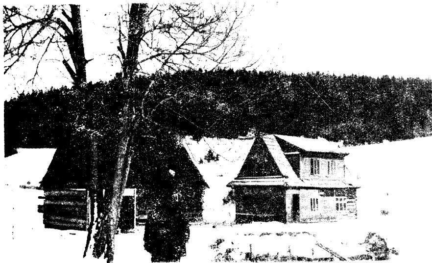
Ryc. 2. Fragment osady cygańskiej, Trybsz, gmina Łapsze Wyżne. Fot. A. Bartosz, 1973

Rodzina cygańska, składająca się z kilkunastu niekiedy osób, mieszkała z reguły w jednej tylko izbie, w której skupiała się większa część działań gospodarczych, a to w szczególności działania dystrybucyjno-adaptacyjne. W wielu przypadkach jeszcze do II wojny w izbie tej zlokalizowany był również warsztat kowalski i tu odbywała się cała działalność rzemieślnicza Cygana. W izbie tej nie było wprost miejsca na zapasy, ale też mentalność cygańska pozostawiała gromadzenie zapasów na marginesie działań gospodarczych 5 . Z wielu jeszcze innych względów pozyskiwanie artykułów spożywczych odbywało się z dnia na dzień, i to