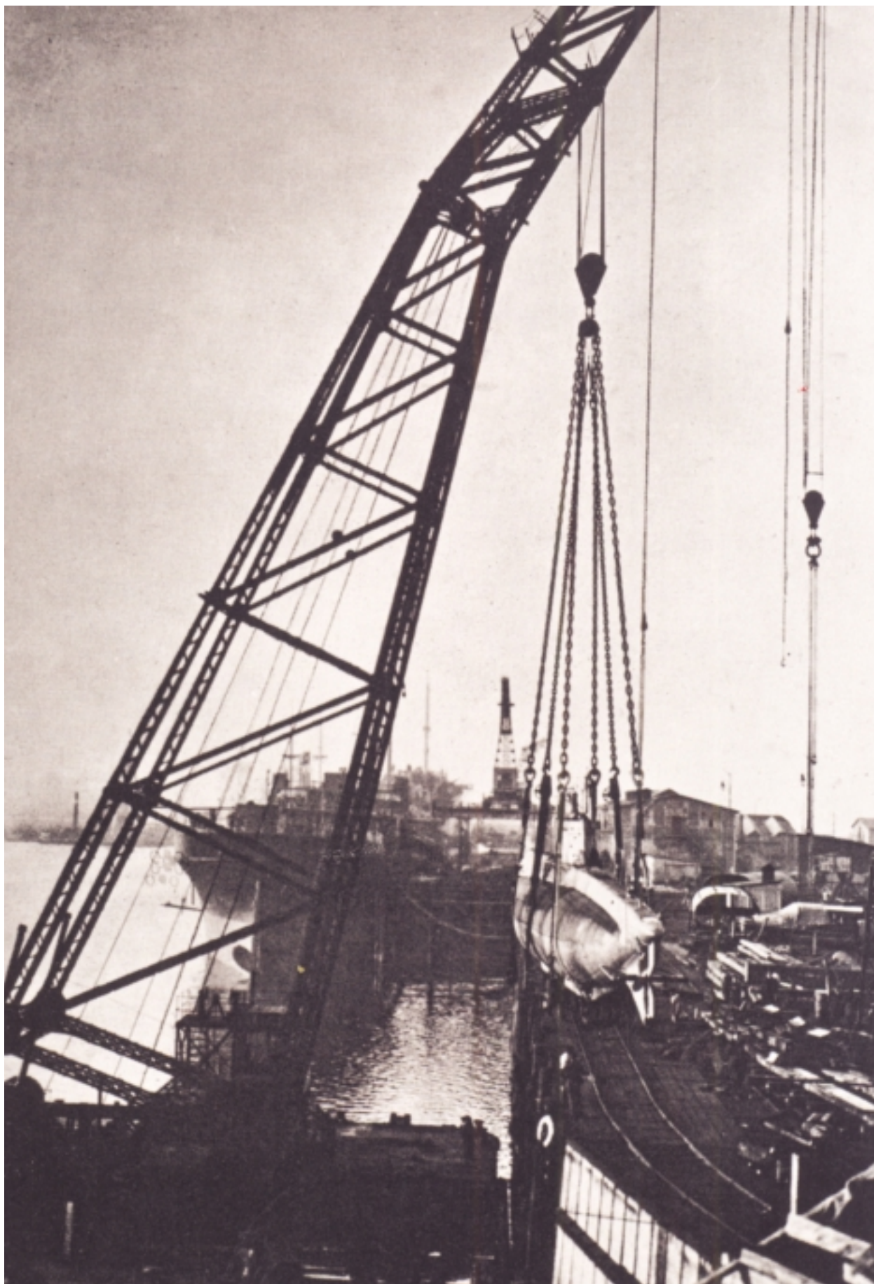
Aby Warburg, Kriegsphotographien 1914-18 , Za: Atlas. Cómo llevar el mundo a cuestras? , katalog wystawy Museo Reina Sofia, Madryt 2010, s. 384