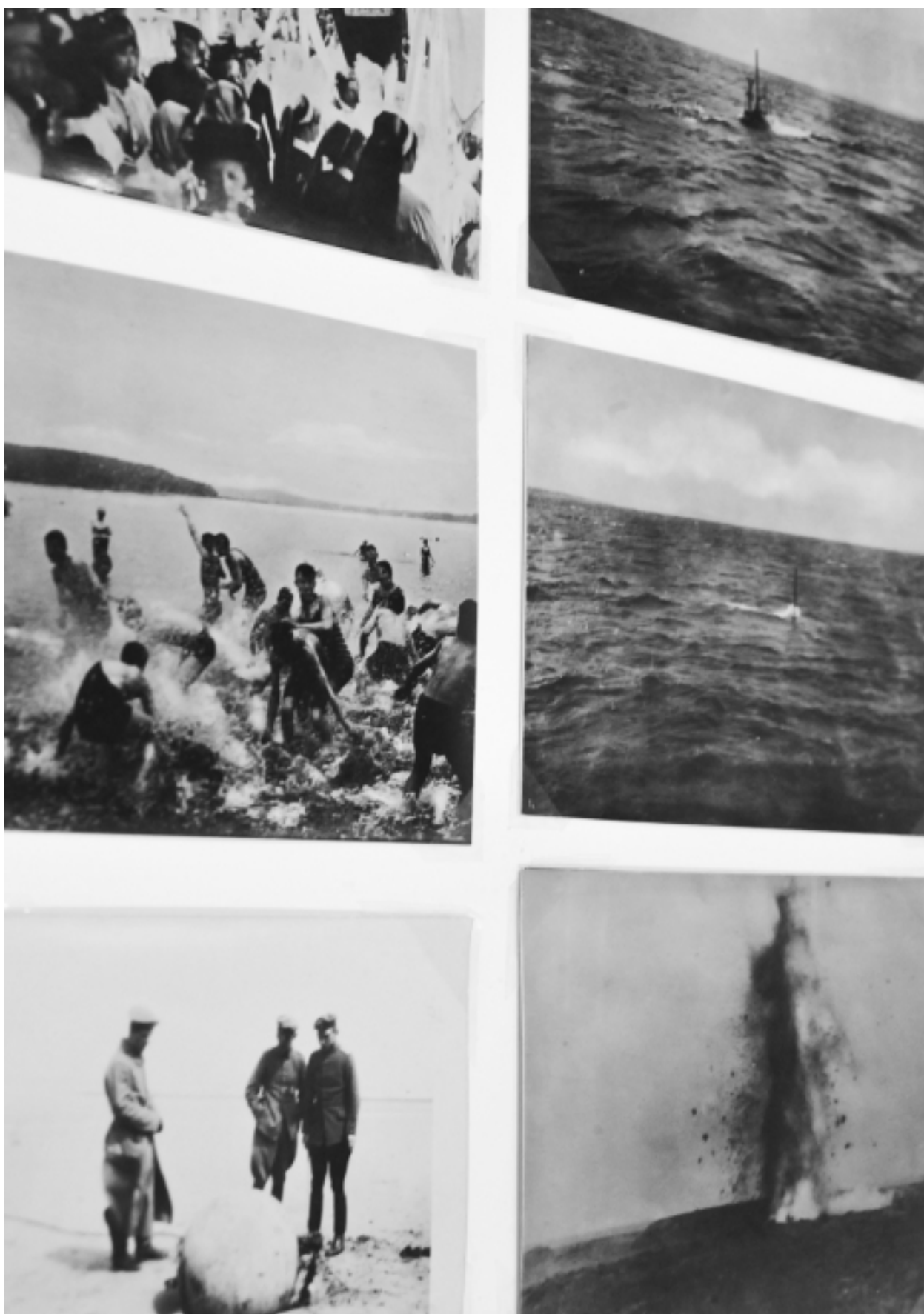
Aby Warburg, Kriegsphotographien , 1914-18. Fragment wystawy Atlas. Cómo llevar el mundo a cuestas? , Museo Reina Sofia, Madryt 2010/11.