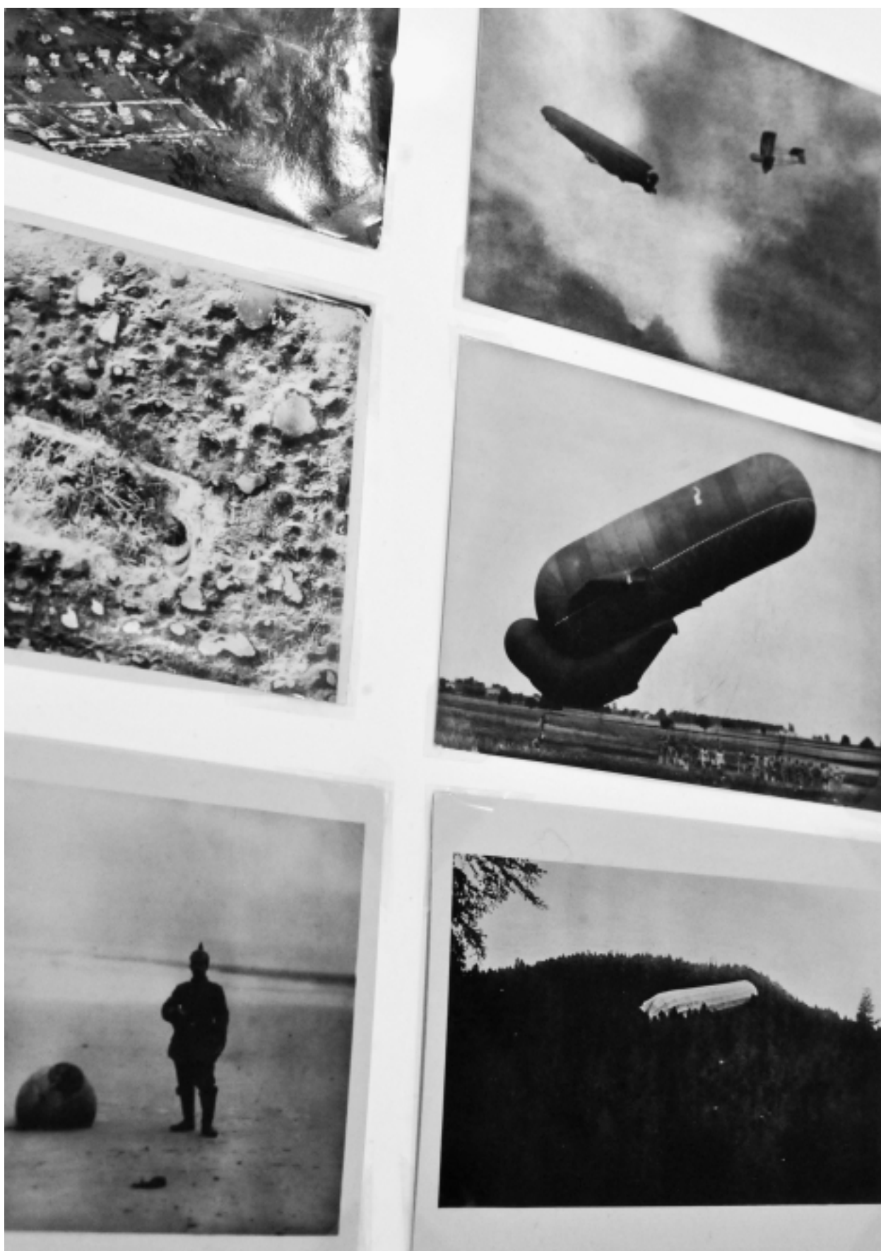
Aby Warburg, Kriegsphotographien , 1914-18. Fragment wystawy Atlas. Cómo llevar el mundo auestas? , Museo Reina Sofia, Madryt 2010/11.